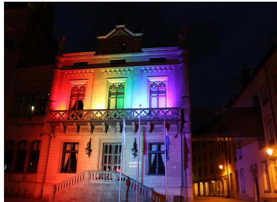
Люксембург, июль 2020 года: Палата депутатов, освещенная цветами радуги по случаю недели гордости (Pride Week)

✘ Люксембург обязуется защищать принципы универсальности, неотчуждаемости, взаимозависимости и неделимости прав человека для всех, поощрять гендерное равенство и бороться со всеми видами дискриминации.