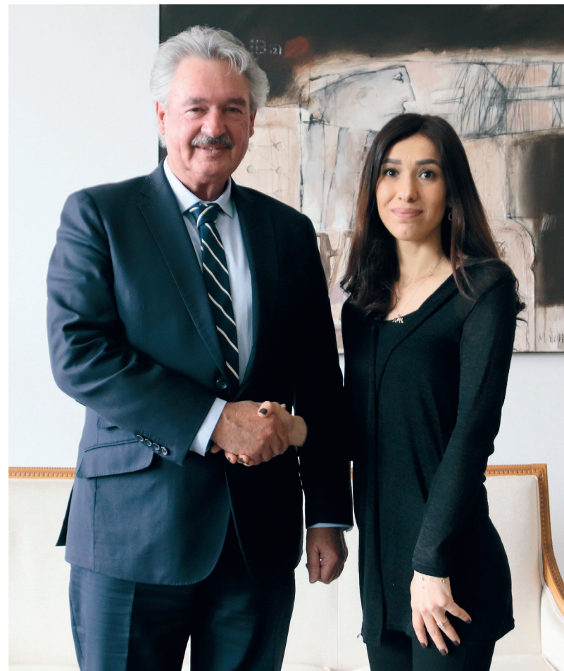
Люксембург, март 2019 года: встреча министра иностранных и европейских дел Люксембурга Жана Ассельборна и правозащитницы, лауреата Нобелевской премии мира Нади Мурад

✳ Люксембург обязуется поддерживать активное и действенное участие гражданского общества и правозащитников в работе Совета по правам человека.