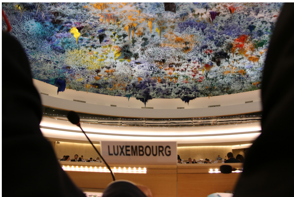
Люксембург в Совете по правам человека