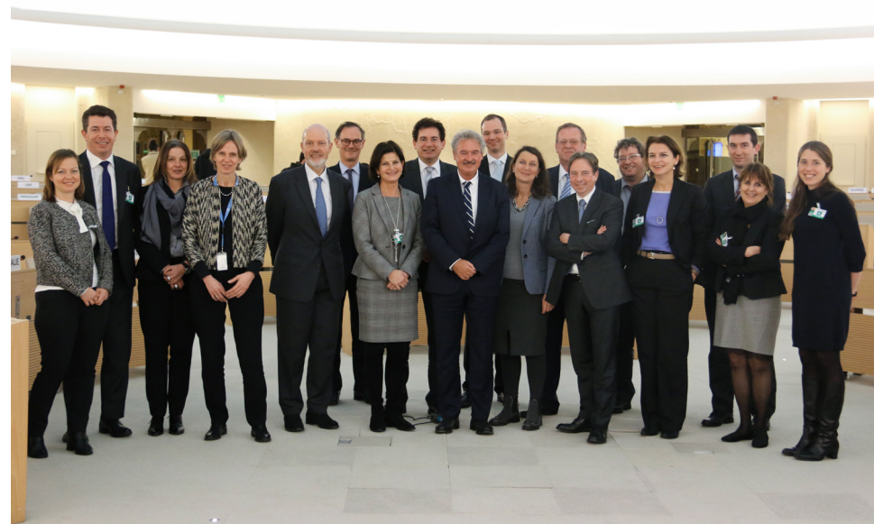
Женева, январь 2018 года: делегация Люксембурга, участвовавшая в представлении национального доклада в рамках 3-го цикла Универсального периодического обзора