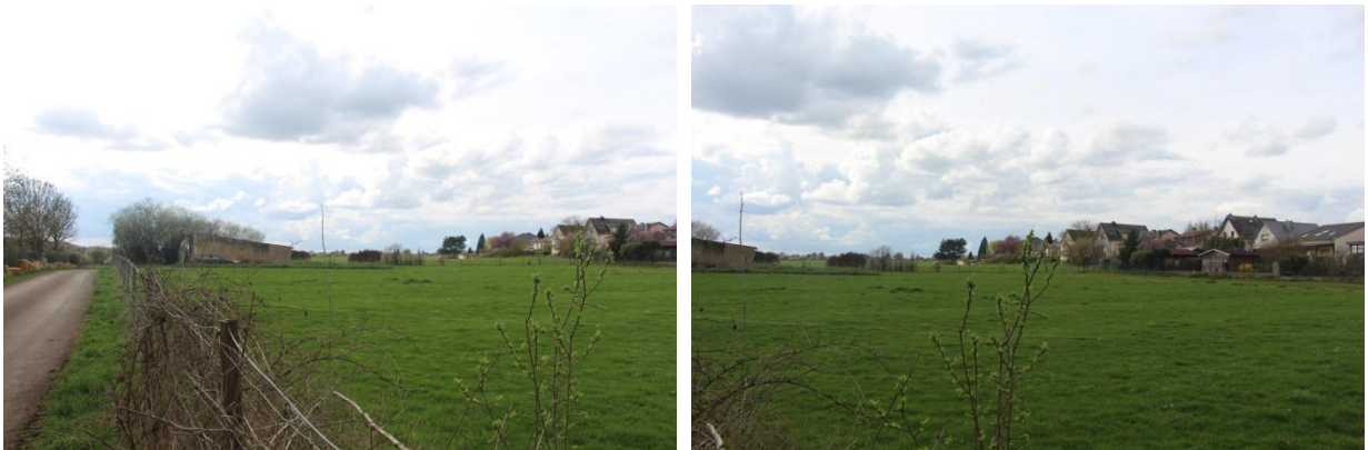
Vues sur le site depuis la rue de l'Ecole