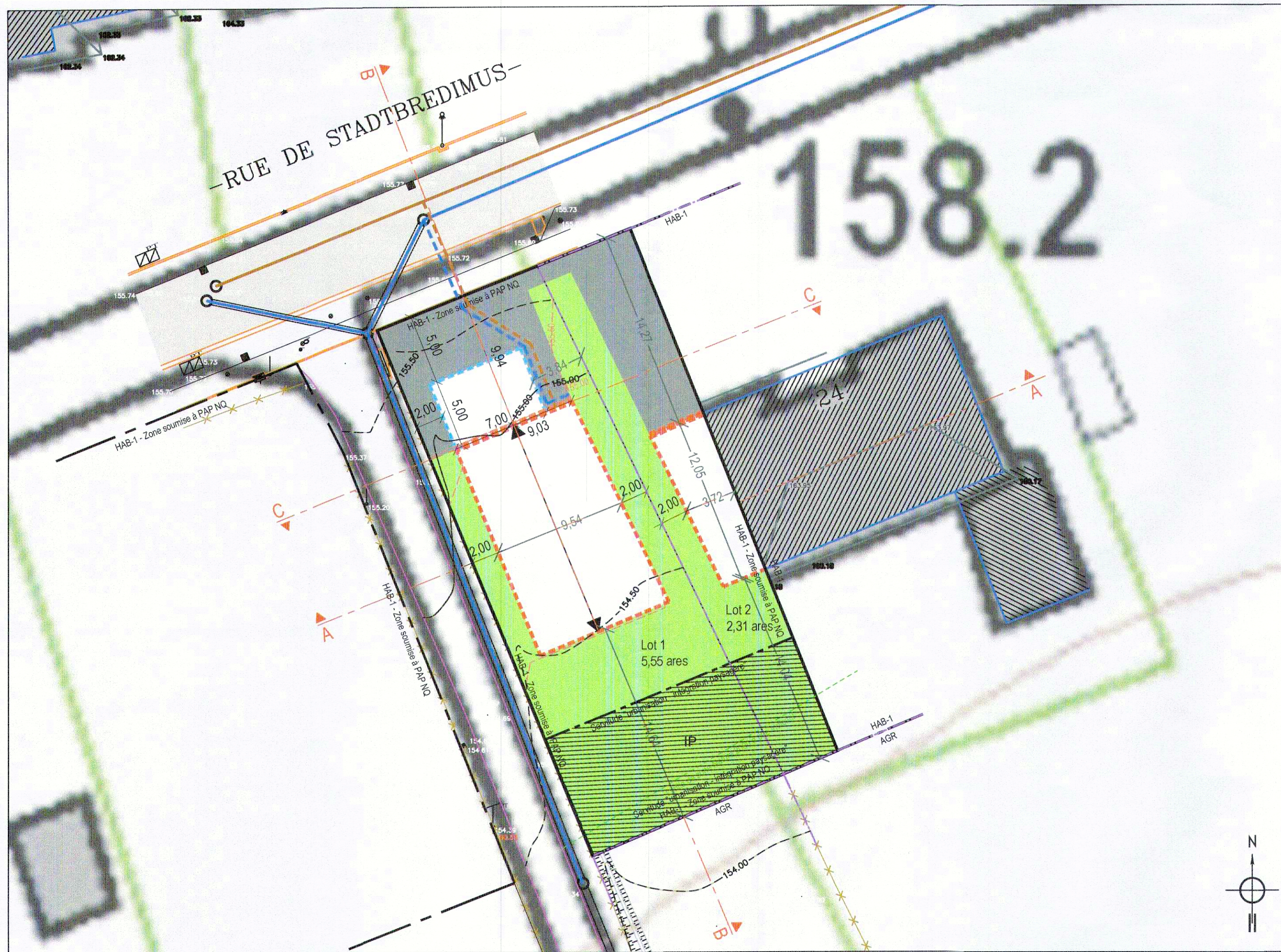
Projet d'Aménagement Particulier 1/250