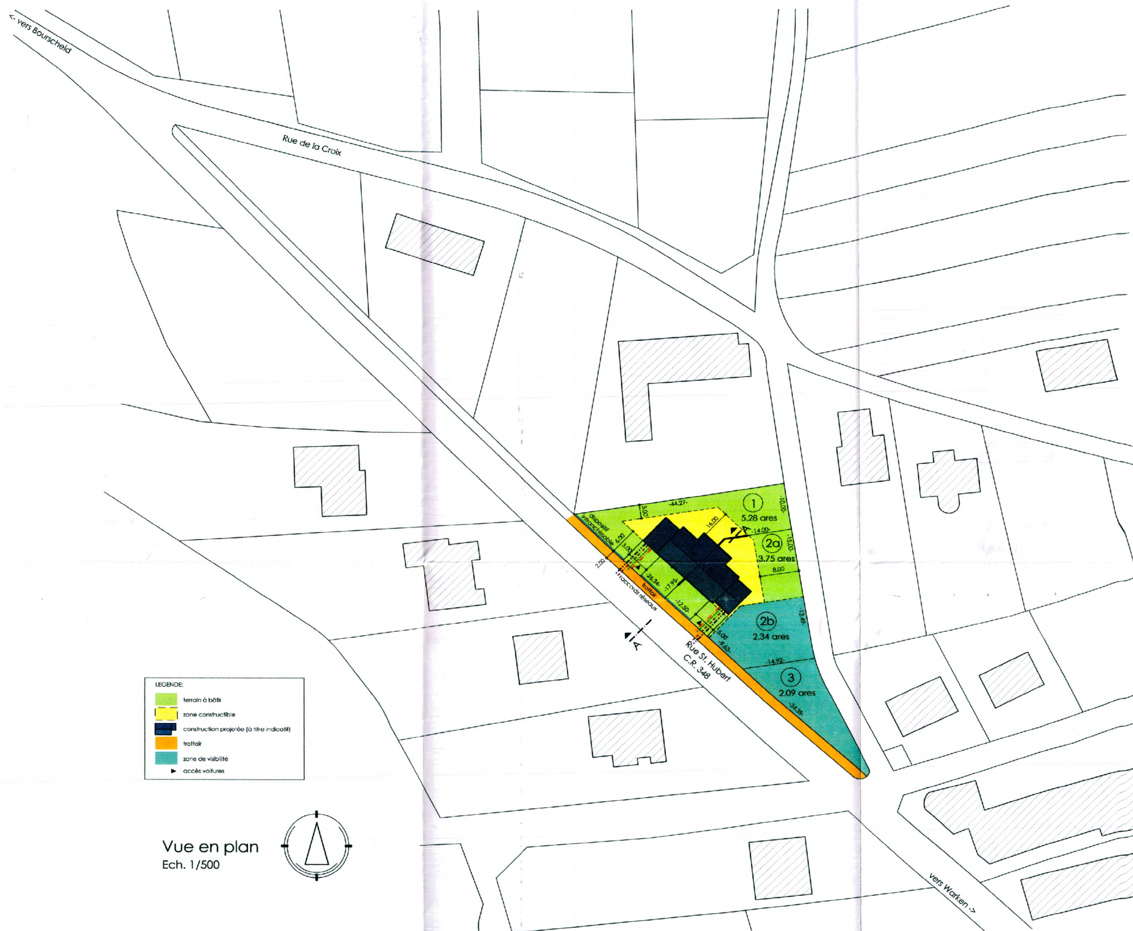
Vue en plan Ech. 1/500