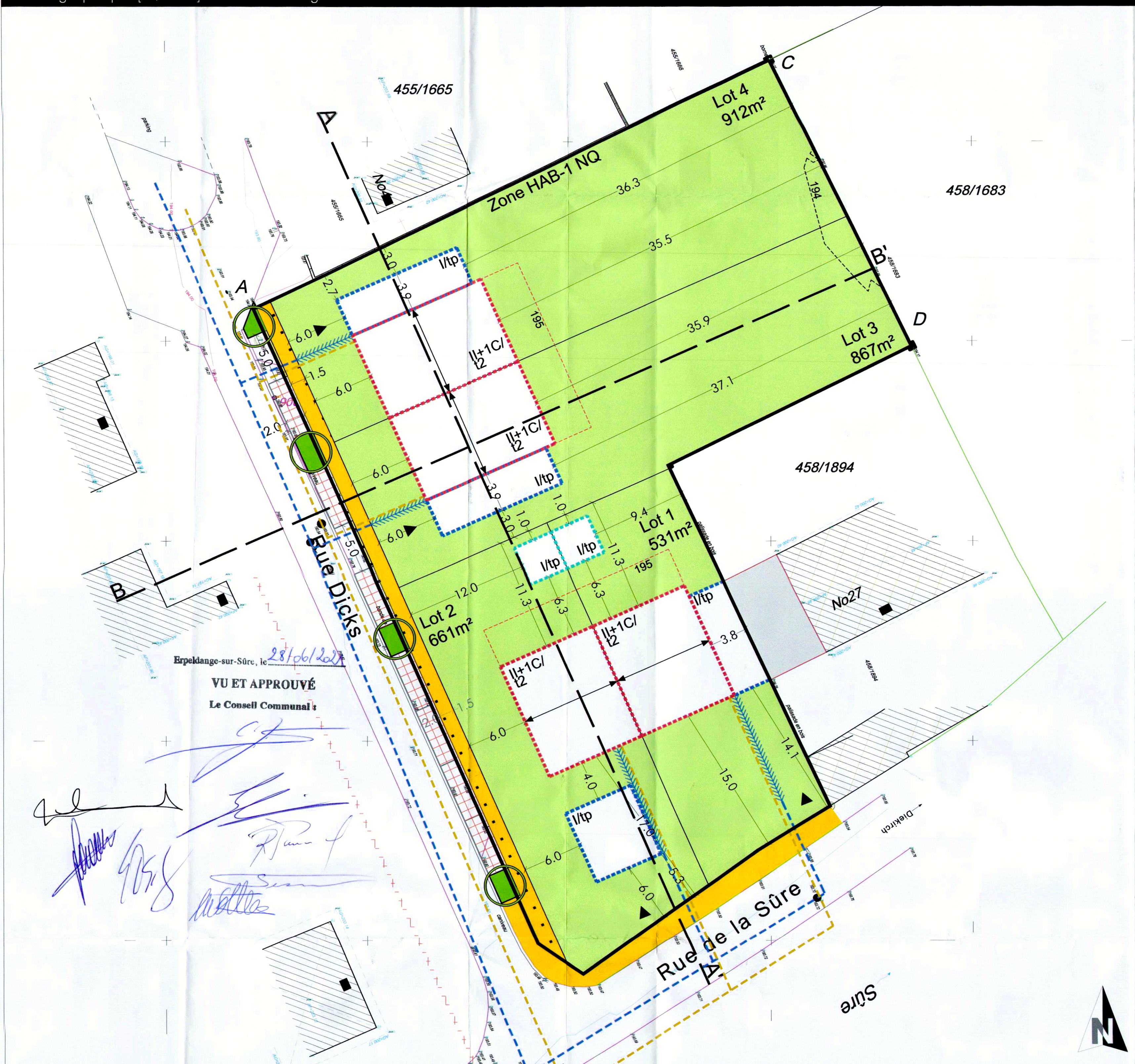
Coupe A-A' [ M 1:250 ]