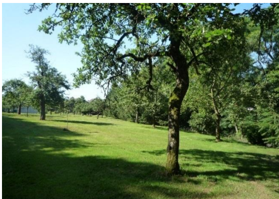
Photos 5 et 6 : Vue sur le pré-verger formant le cœur de la zone E17.

Vue depuis la limite entre les zones E16 et E17 sur les pâturages et les vergers composant le site. En arrière-plan se distingue le hangar agricole le long de la Porte des Ardennes.