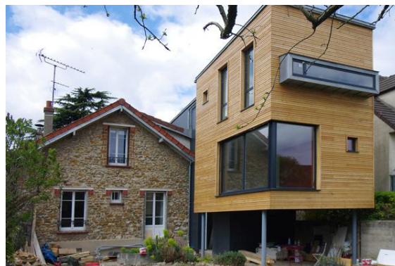
Exemple d'extension surélevée