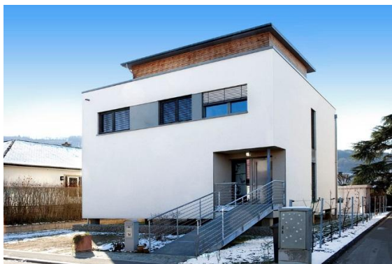
Maison sur pilotis à Ingeldorf