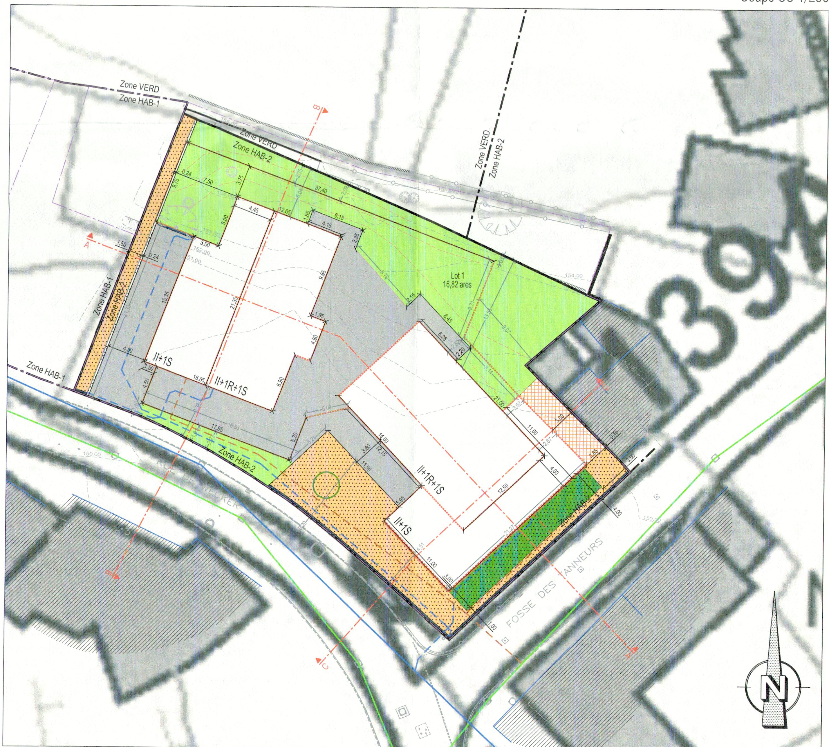
Projet d'Aménagement Particulier 1/250