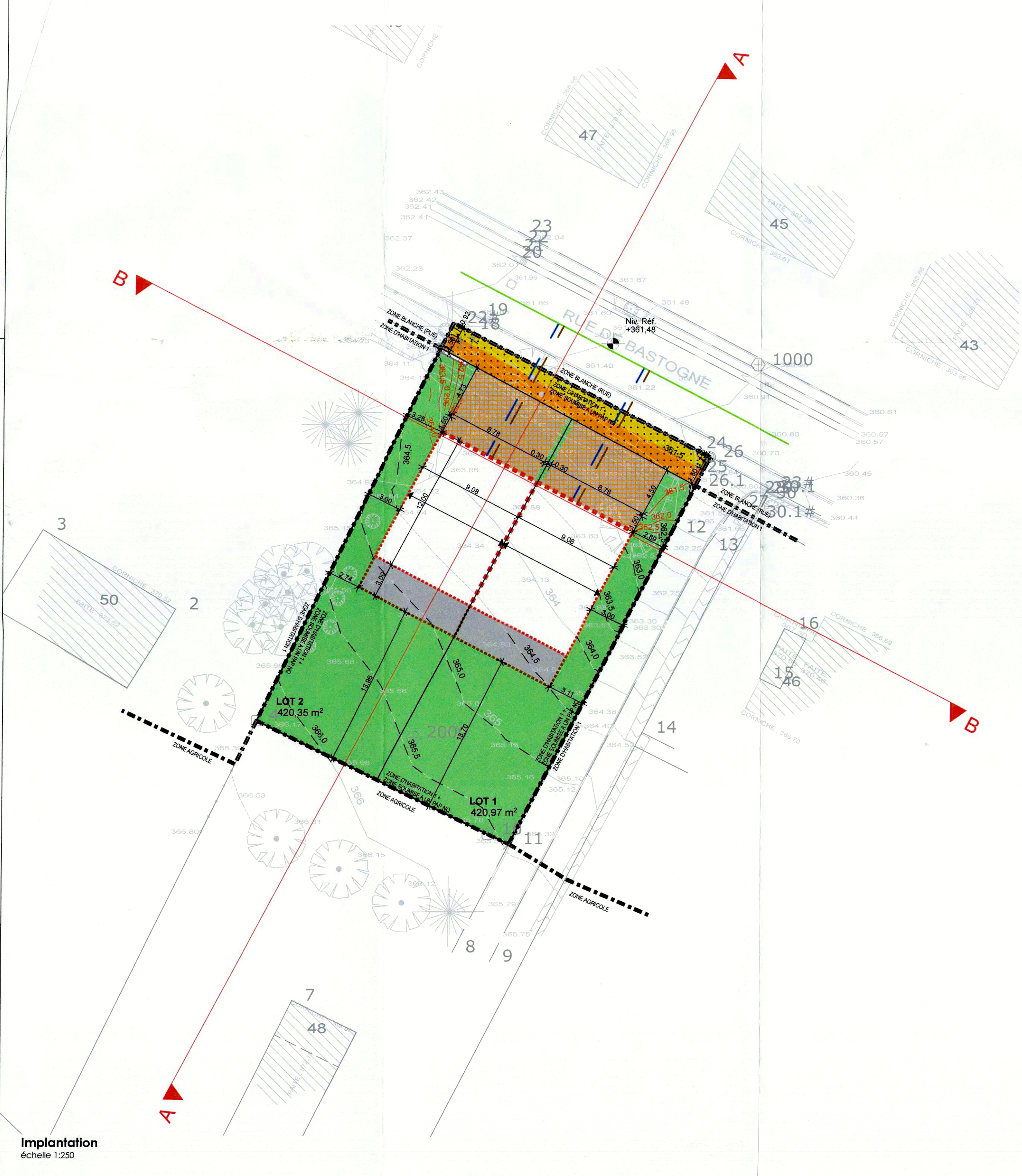
Implantation échelle 1:250