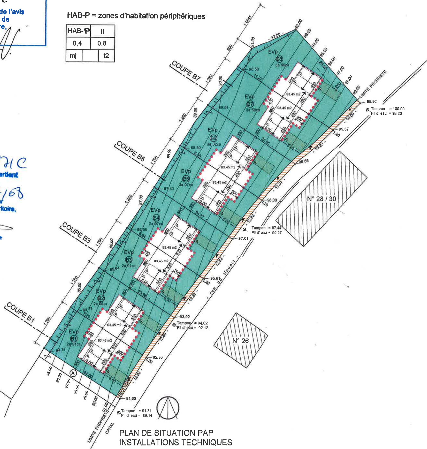
PLAN DE SITUATION PAP INSTALLATIONS TECHNIQUES