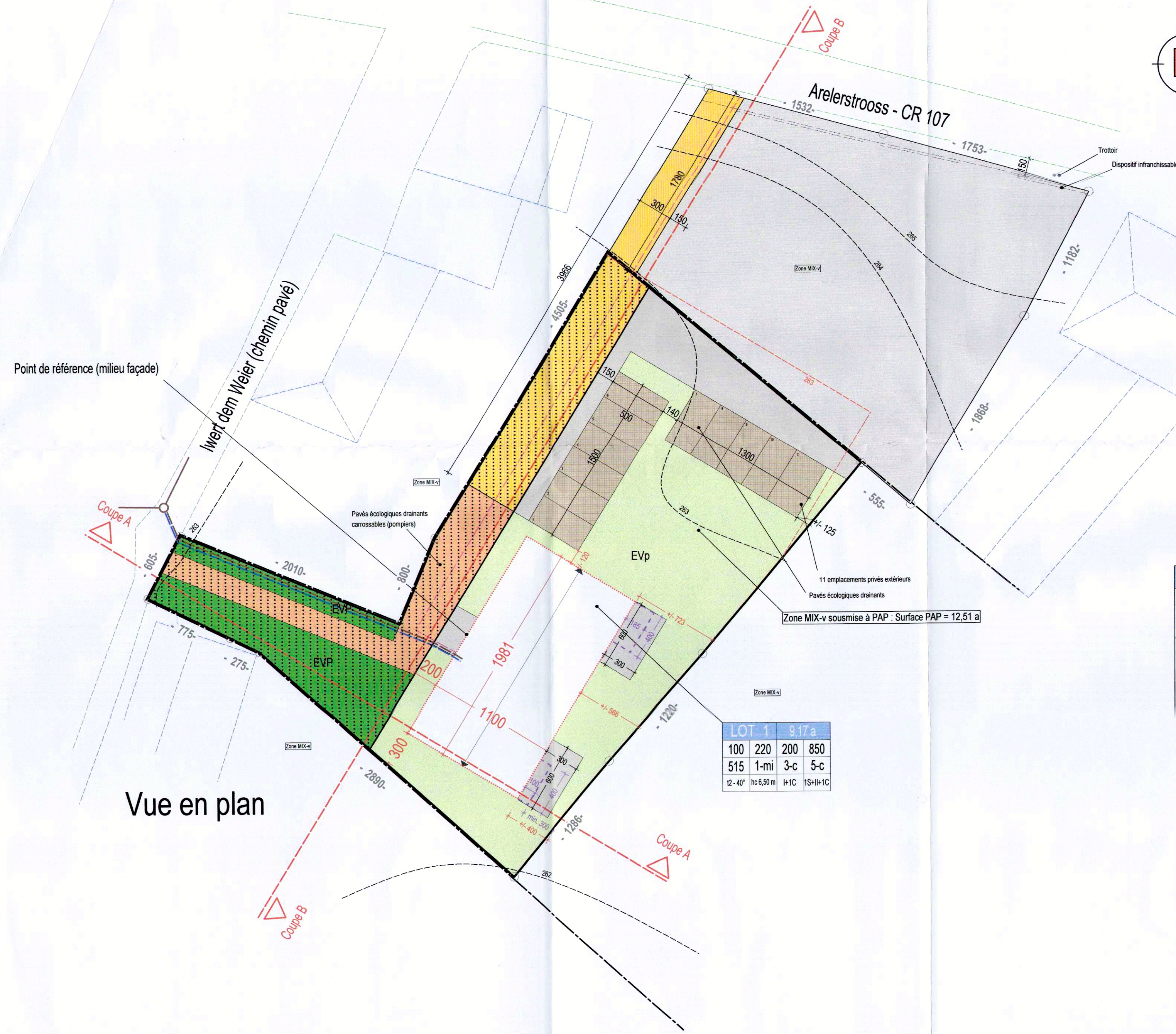
Vue en plan