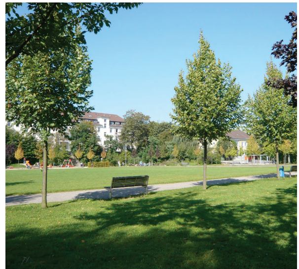
Trame verte © FörderLandschaftsarchitekten