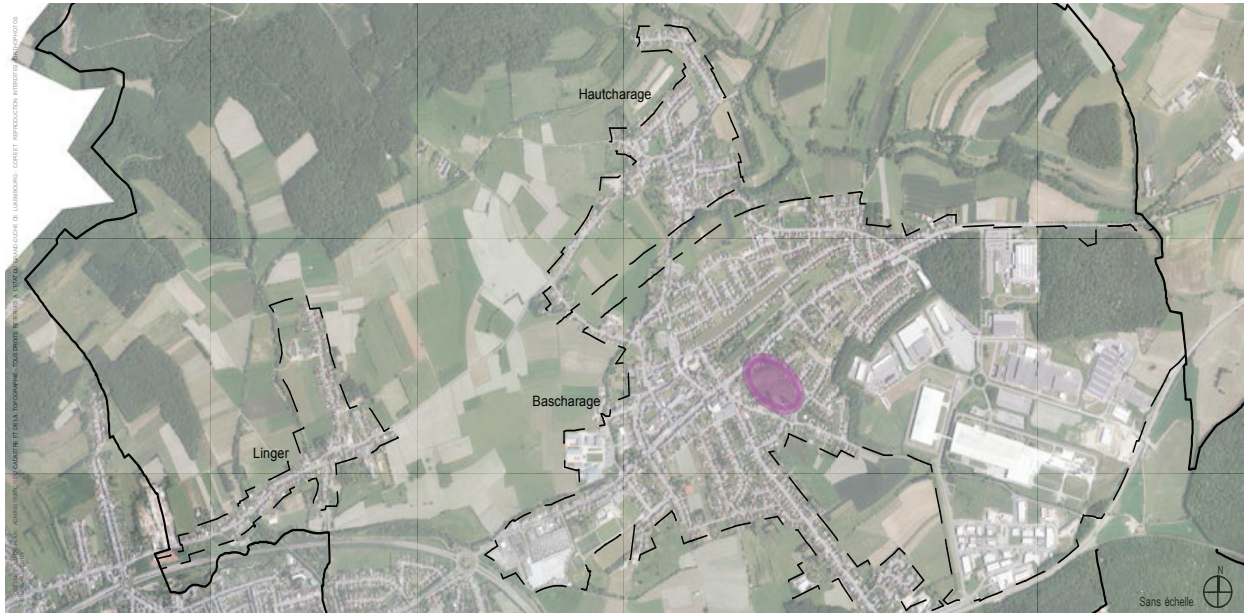
Situation dans la localité de Bascharage