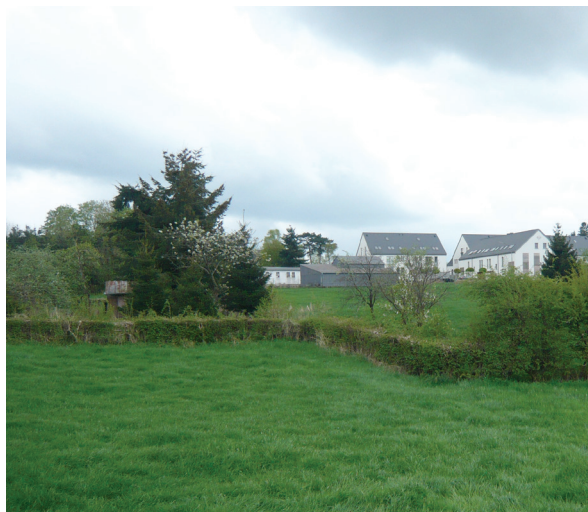
Intégration au paysage