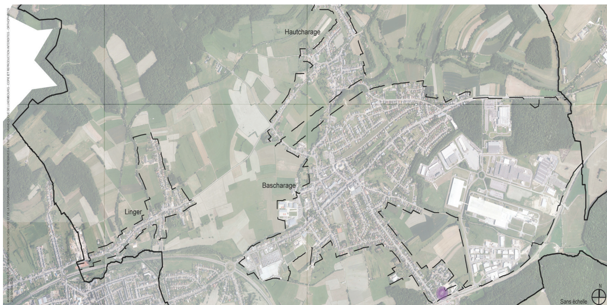
Situation dans la localité de Bascharage