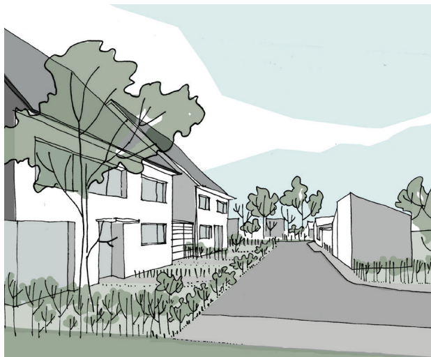
Espace de rencontre