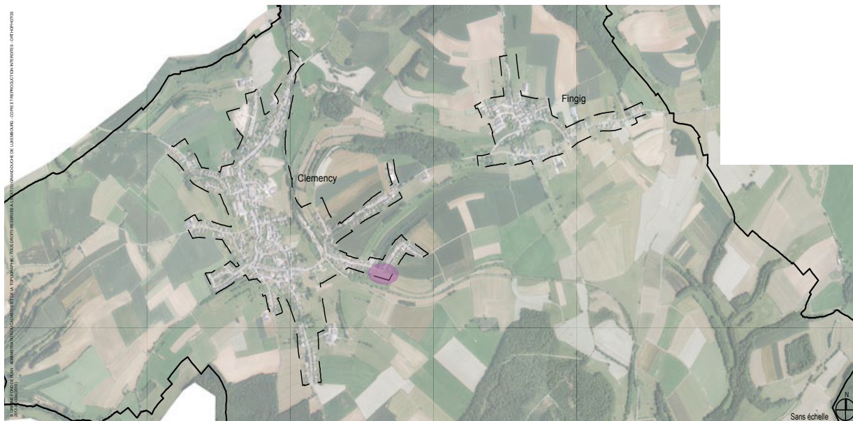
Situation dans la localité de Clemency