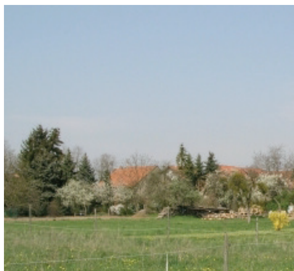
Intégration au paysage © FörderLandschaftsarchitekten