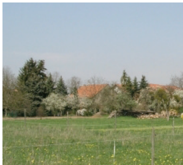
Intégration au paysage © FörderLandschaftsarchitekten