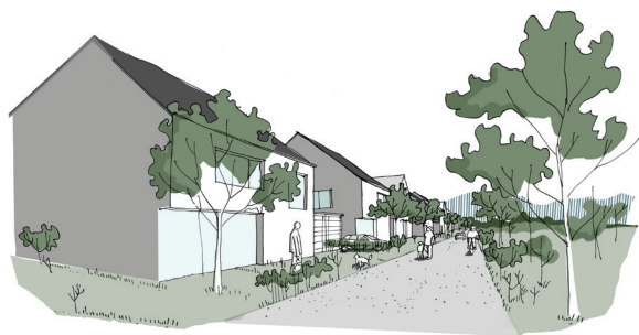
Espace de rencontre