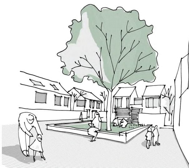
Espace minéral cerné