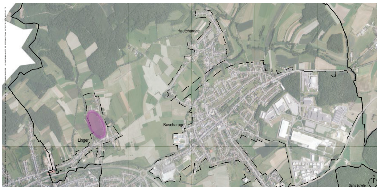
Situation dans la localité de Linger