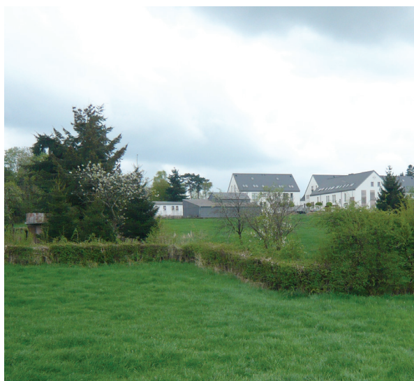
Intégration au paysage © FörderLandschaftsarchitekten