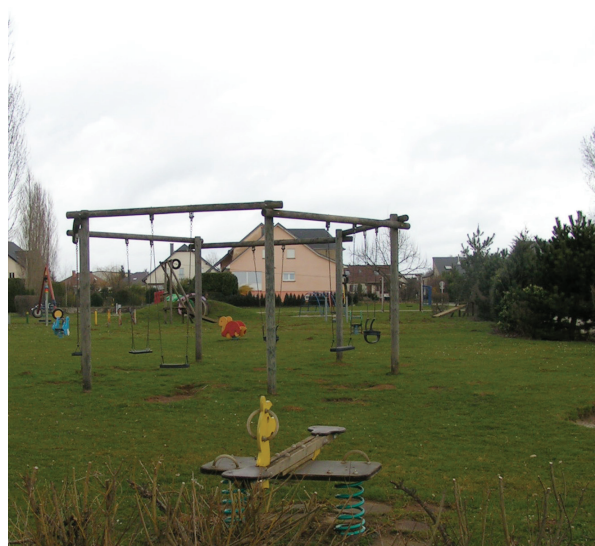
Espace vert cerné © FörderLandschaftsarchitekten