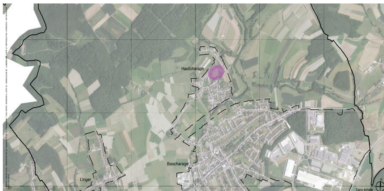
Situation dans la localité de Hautcharage