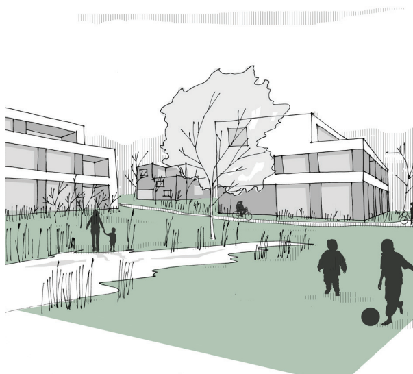
Espace vert cerné