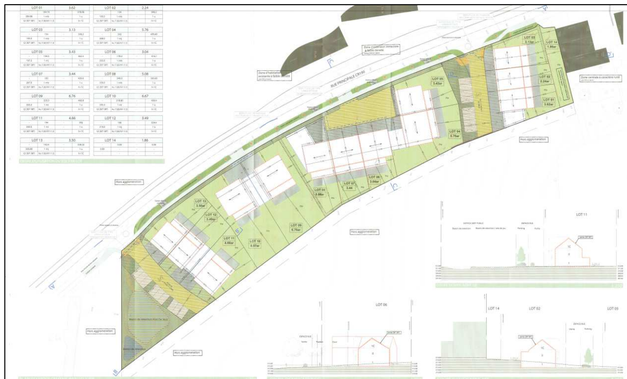
Extrait PAP n°18306 approuvé le 23/10/2018 par le ministre de l'Intérieur