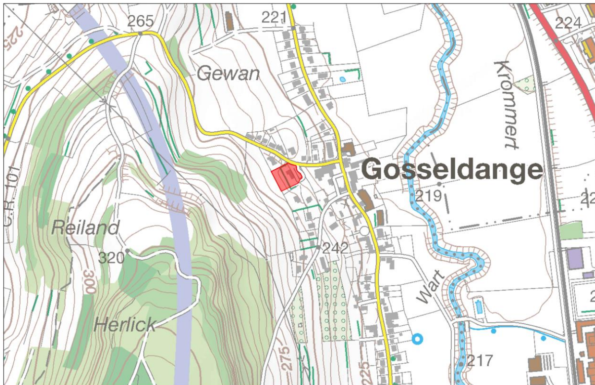
Abbildung 1 Verortung des Plangebietes (Topografische Karte)