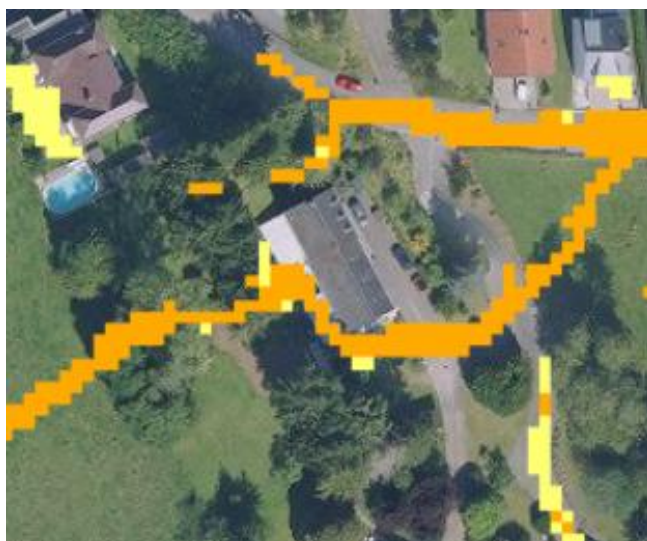
Abbildung 4 Starkregengefahr