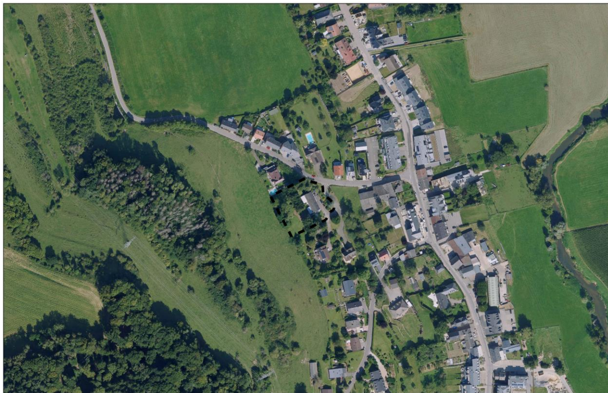
Abbildung 2 Verortung des Plangebietes (Luftbild)

Quelle: Administration du Cadastre et de la Topographie, Orthophoto, 2021