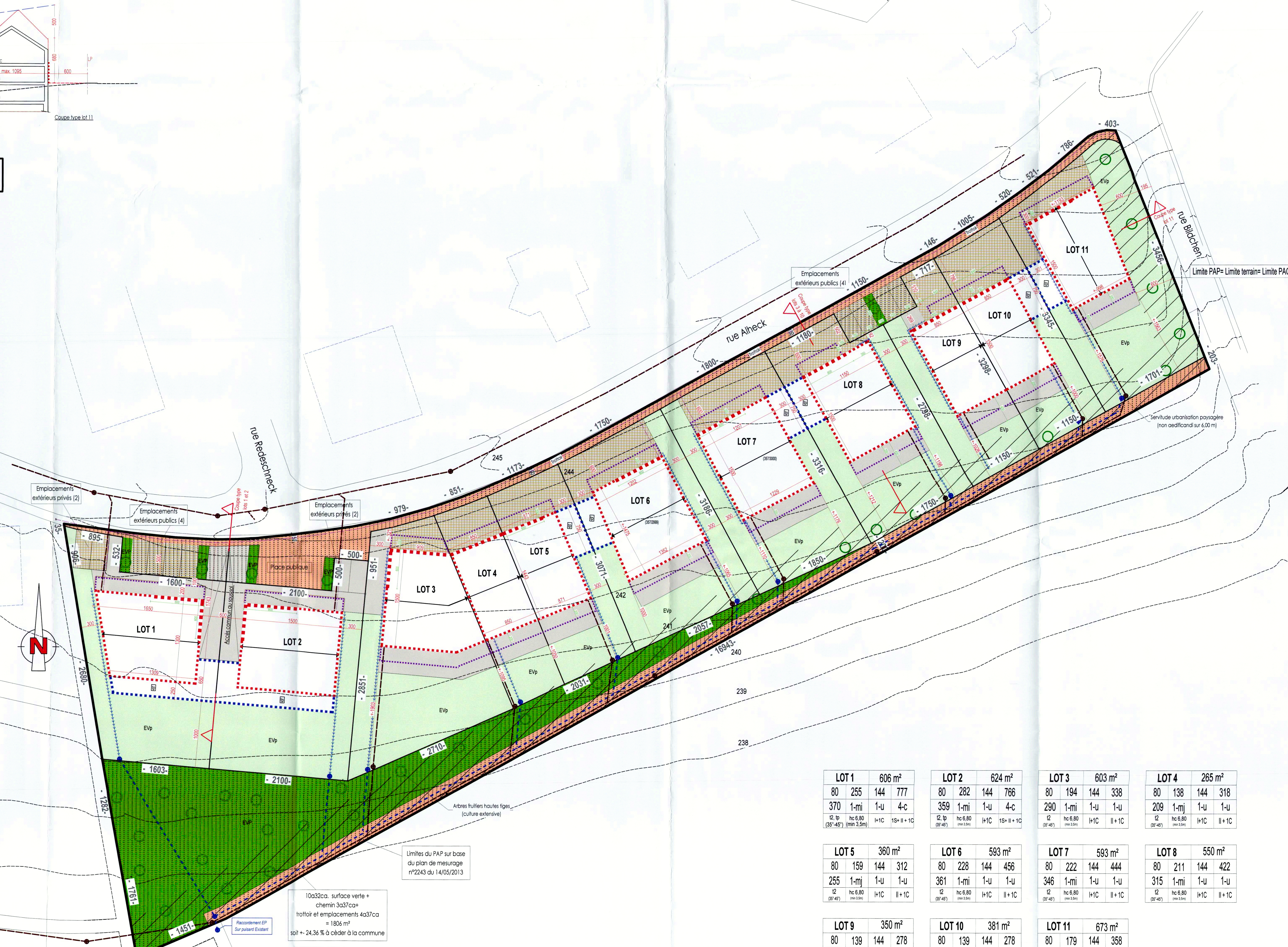
Vue en plan