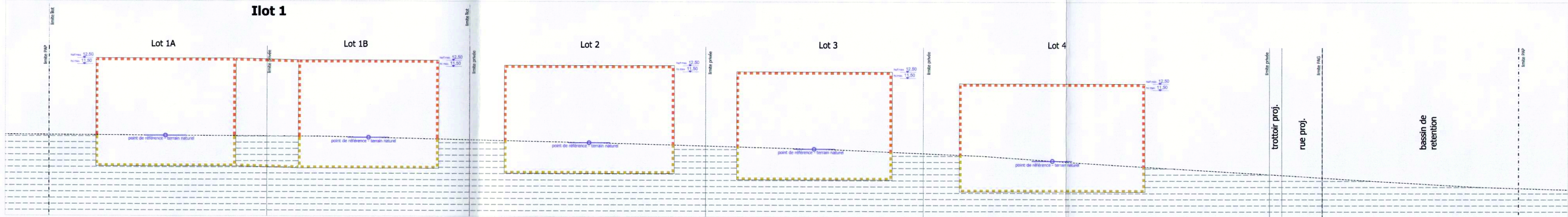
Coupe A-A' schématique - 1/500