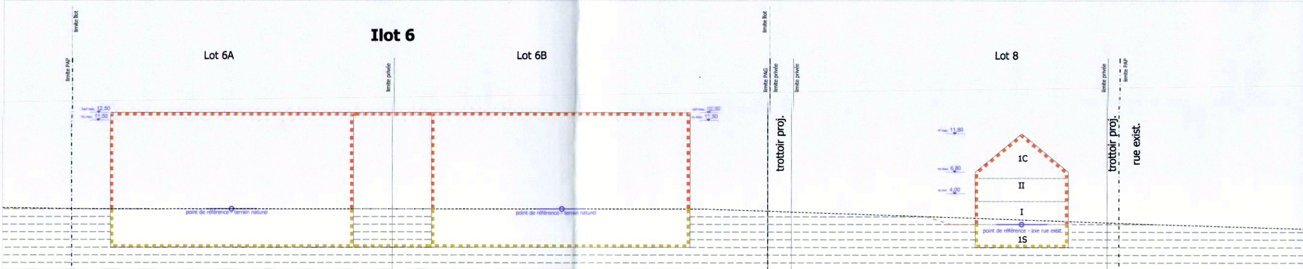
Coupe C-C' schématique - 1/500