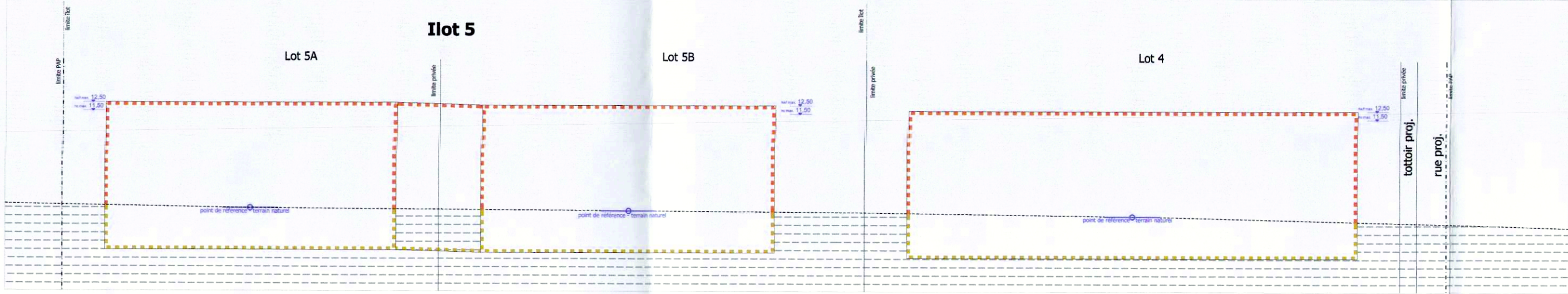
Coupe B-B' schématique - 1/500