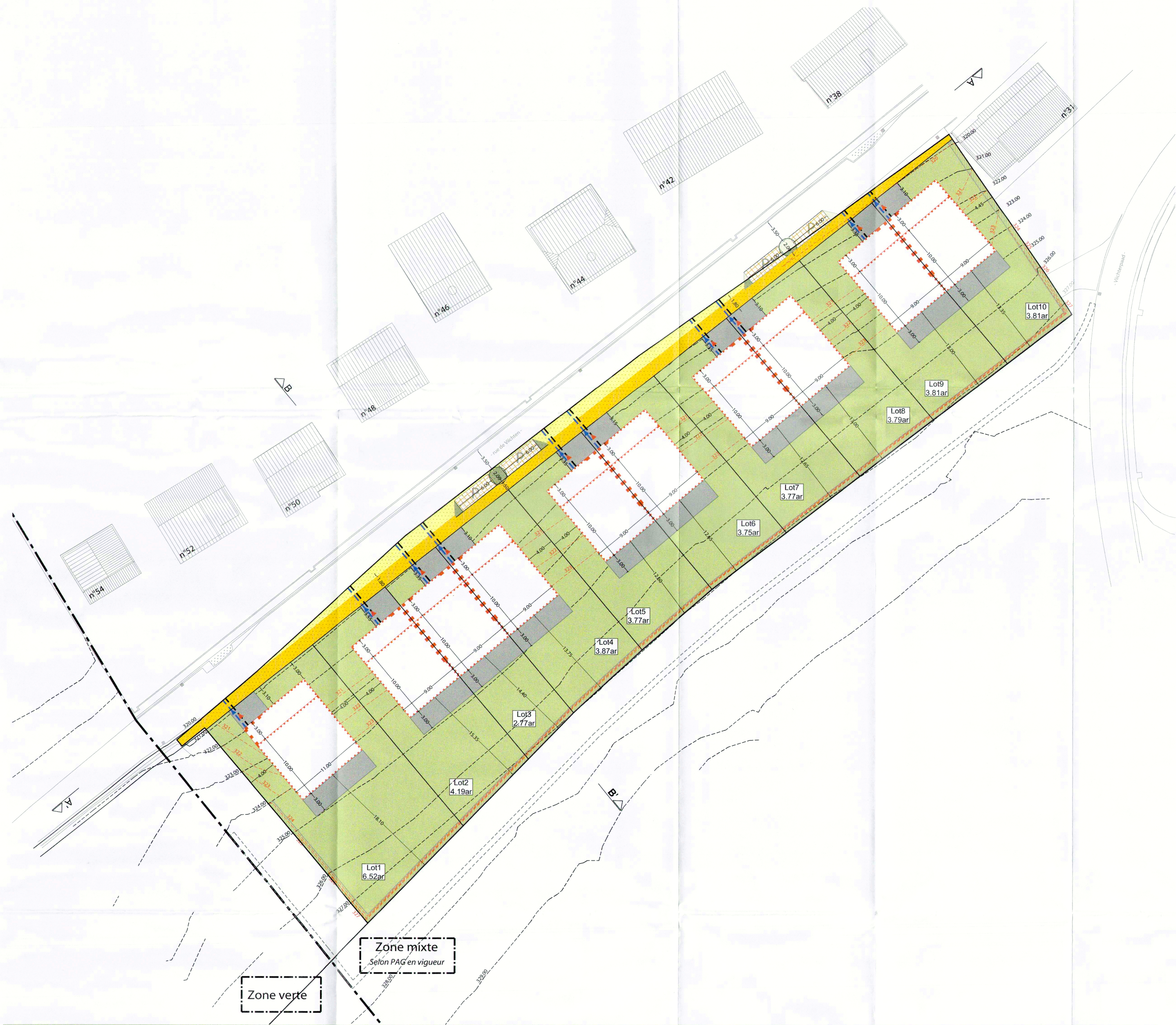
PLAN D'AMENAGEMENT PARTICULIER 1.250