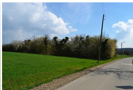
Biotope limitant la zone de projet au nord-est du site