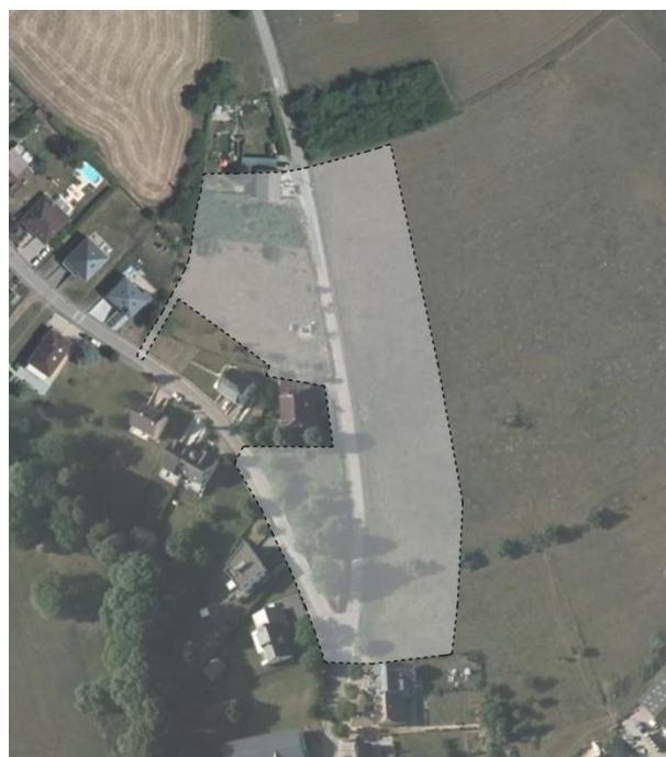
SCHÉMA DIRECTEUR A-NQ2 ZAD – Am Weiergaart