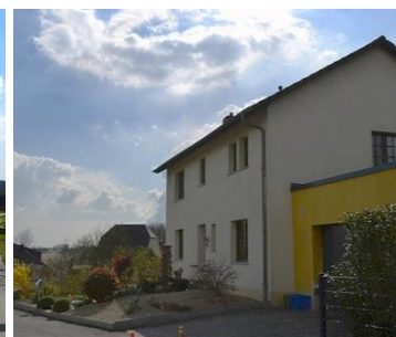
Habitation existante n°59 rue des Romains