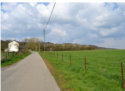
Entrée sud du quartier