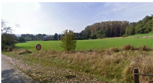
Site, vue vers le sud