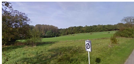
Site, vue vers le nord