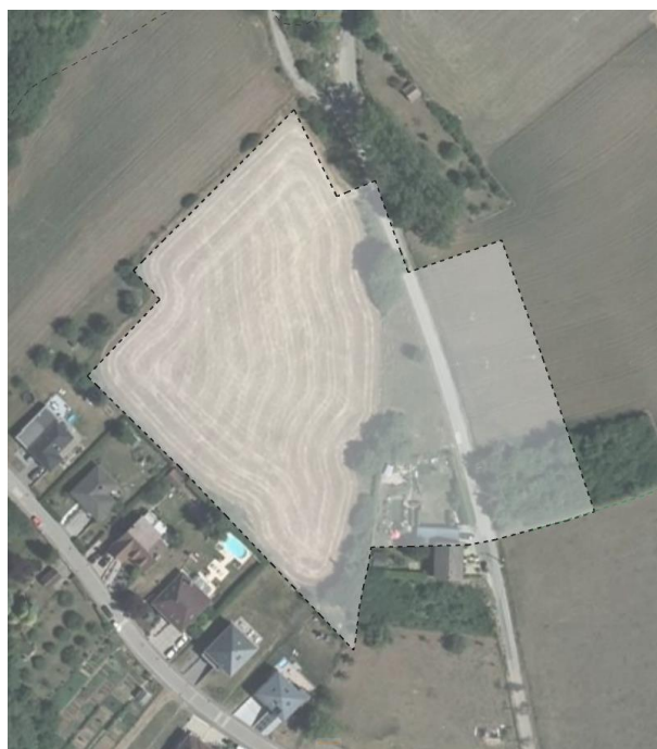
SCHÉMA DIRECTEUR A-NQ3 ZAD – Beim Houbur