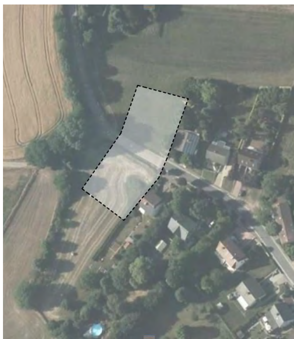
SCHÉMA DIRECTEUR A-NQ5 – Filsdorf