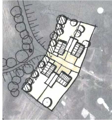
Proposition d'aménagement du site