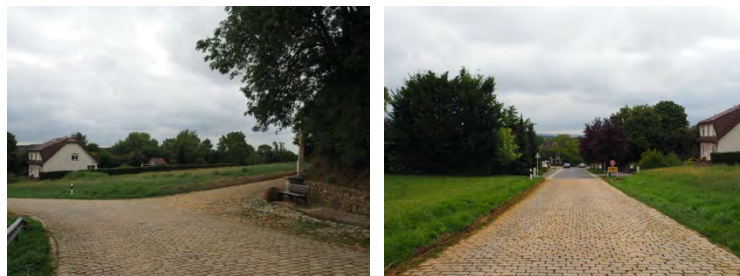
Entrée de localité