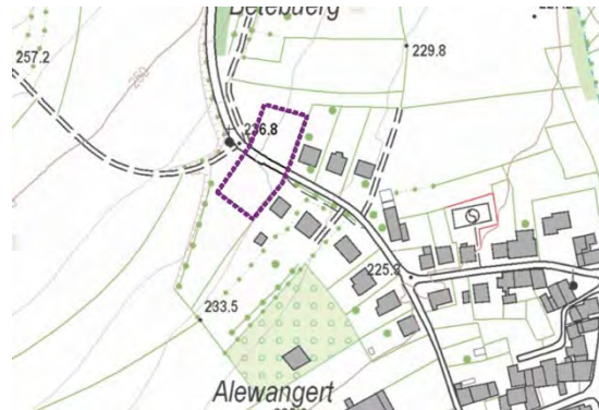
Carte topographique ACT, droits réservés à l'Etat du Grand-Duché de Luxembourg (1998-2000)