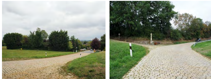
Pavés à conserver