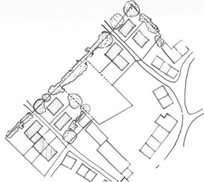
Proposition d'aménagement du site