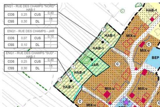
Extrait de la partie graphique du PAG

ACT, droits réservés à l'Etat du Grand-Duché de Luxembourg (1998-2000)