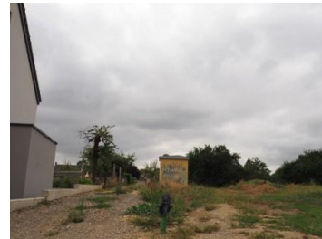
Site, sud de la rue Killen