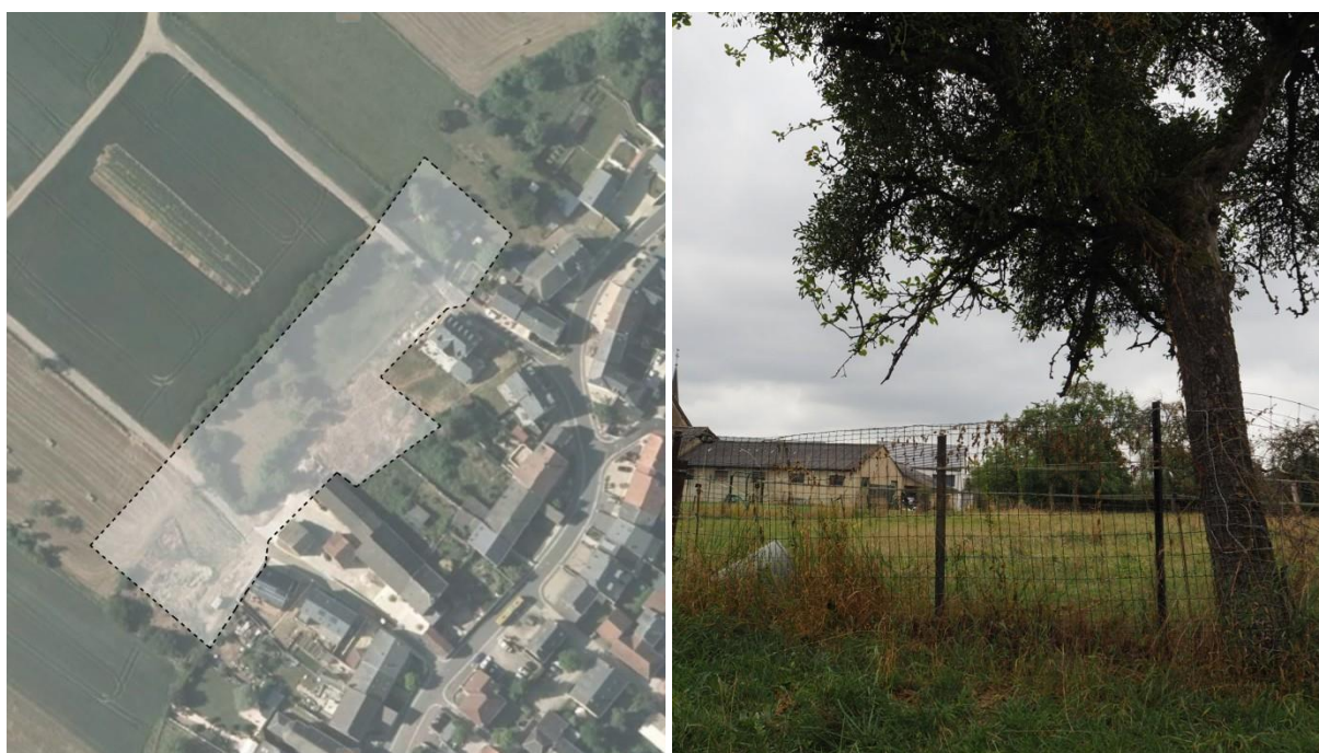
SCHÉMA DIRECTEUR E-NQ1 – Rue des Champs