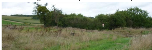
Haie vive le long de la zone agricole au nord-ouest du site