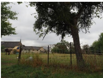
Cœur du site