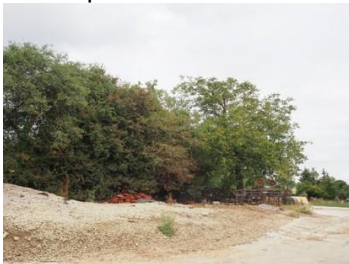
Site, nord de la rue Killen