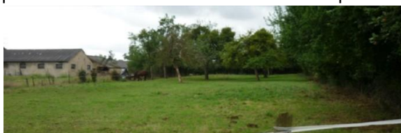
Biotope protégé au cœur du site