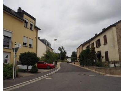
Rue des Champs