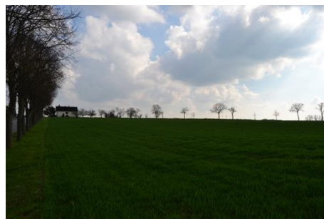
Vue depuis la rue du Cimetière