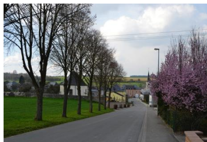
Alignement d'arbres à conserver, rue du Cimetière