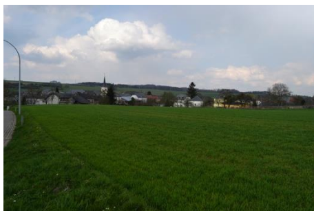
Vue depuis la rue de l'Eau