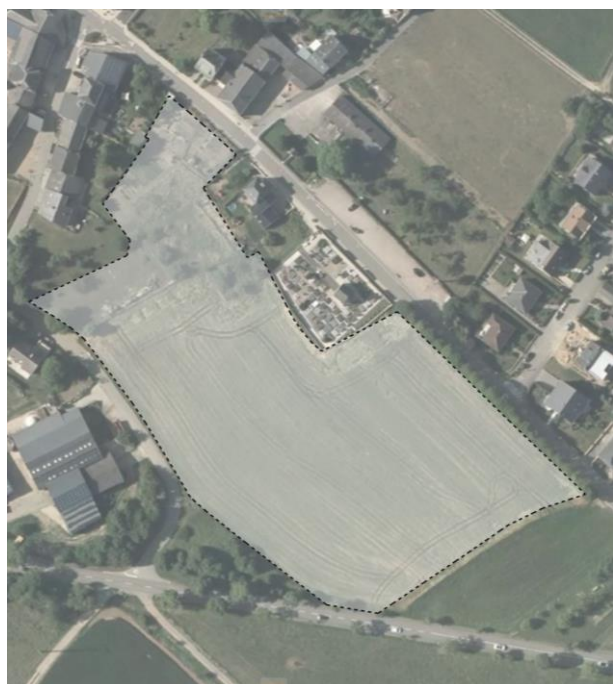
SCHÉMA DIRECTEUR E-NQ3 – Am Kiirchebongert