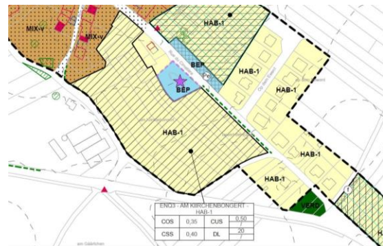
Extrait de la partie graphique du PAG