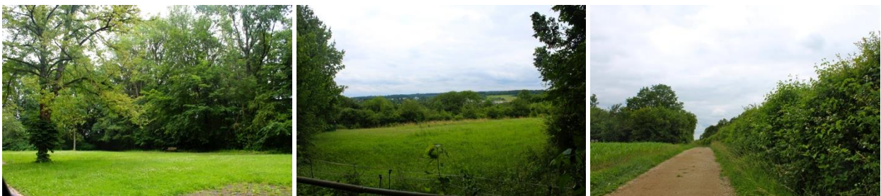
Intérieur du site