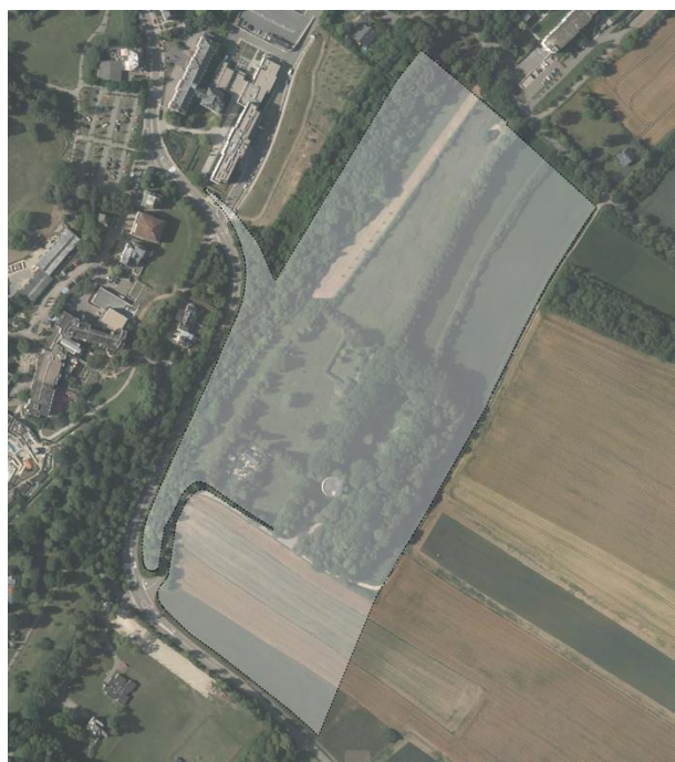
SCHÉMA DIRECTEUR M-NQ5 ZAD – Am Klengen Park