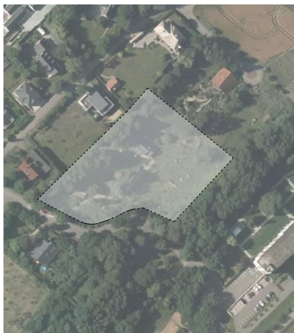
SCHÉMA DIRECTEUR M-NQ6 – Belle Vue