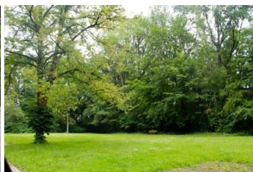
Parc arboré à l'est du site