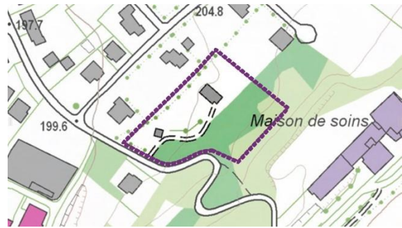
Carte topographique ACT, droits réservés à l'Etat du Grand-Duché de Luxembourg (1998-2000)