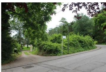
Accès existant vers le site