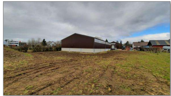
Abbildung 17: Blick 5 Richtung angrenzende Bestandsbebauung