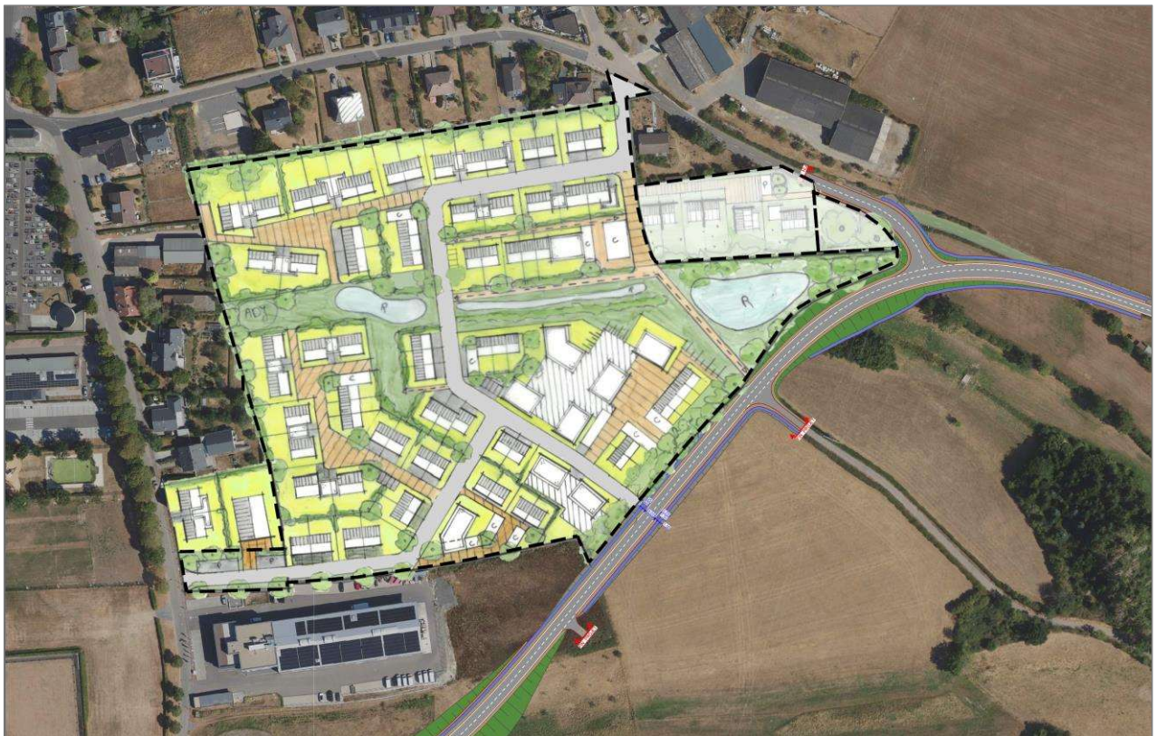
Abbildung 19: Städtebauliches Konzept der SD-Fläche NQ21.

Die Plangebietsfläche fällt nach Südosten hin etwas ab, zentral verläuft ein Talweg. Bei der Bebauung sollen die topographischen Gegebenheiten berücksichtigt werden. Der Talweg soll im Zuge der Umsetzung des PAP-Projekts weiter profiliert werden, indem dessen südlicher Teilbereich durch gezielte Aufschüttungen etwas erhöht wird. Um die notwendigen Aufschüttungen in diesem Bereich möglichst gering halten zu können, soll in Betracht gezogen werden, die Höhendifferenz durch Keller- oder Gartengeschosse auszugleichen (z.B. Tiefgarage für Mehrfamilienhausbebauung).