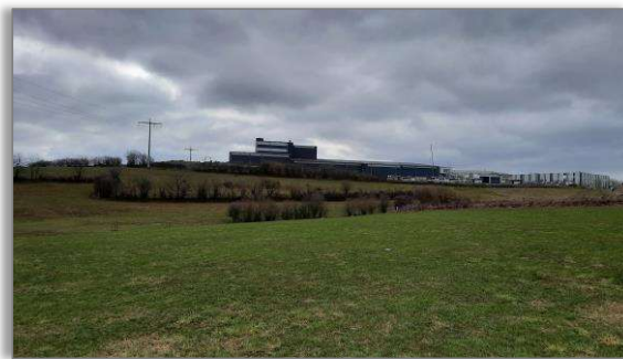
Abbildung 14: Blick 2 nach Südwesten