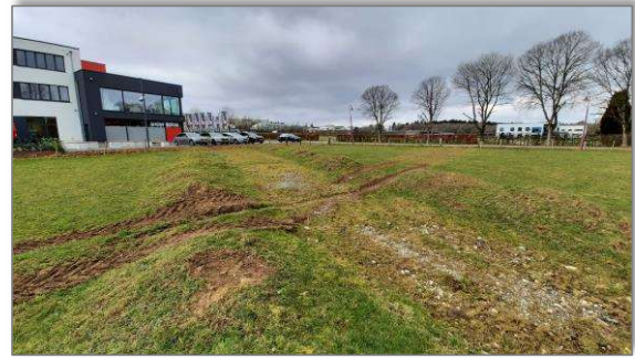
Abbildung 13: Blick 1 Richtung Elektrobetrieb und die Straße „Bei der Kapell“