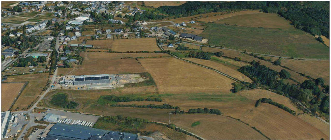
Abbildung 21: 3D-Modell der Plangebietsflächen und der Umgebung. Blick Richtung Norden.