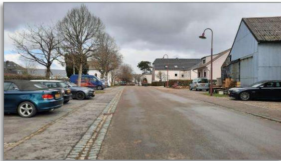
Abbildung 16: Blick 4 Richtung Norden („Bei der Kapell“)