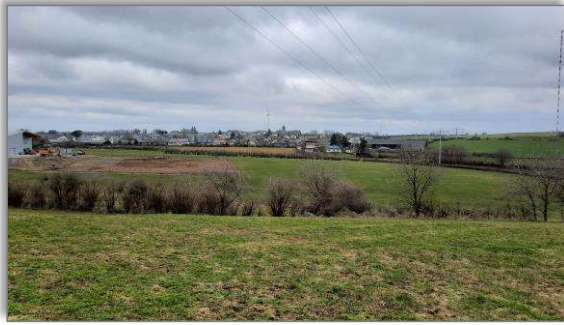
Abbildung 12: Übersicht des Plangebietes von Süden aus