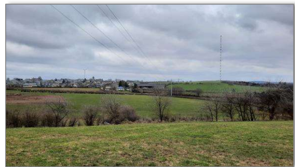
Abbildung 15: Blick 3 Richtung Nordwesten („Eesberwee“)