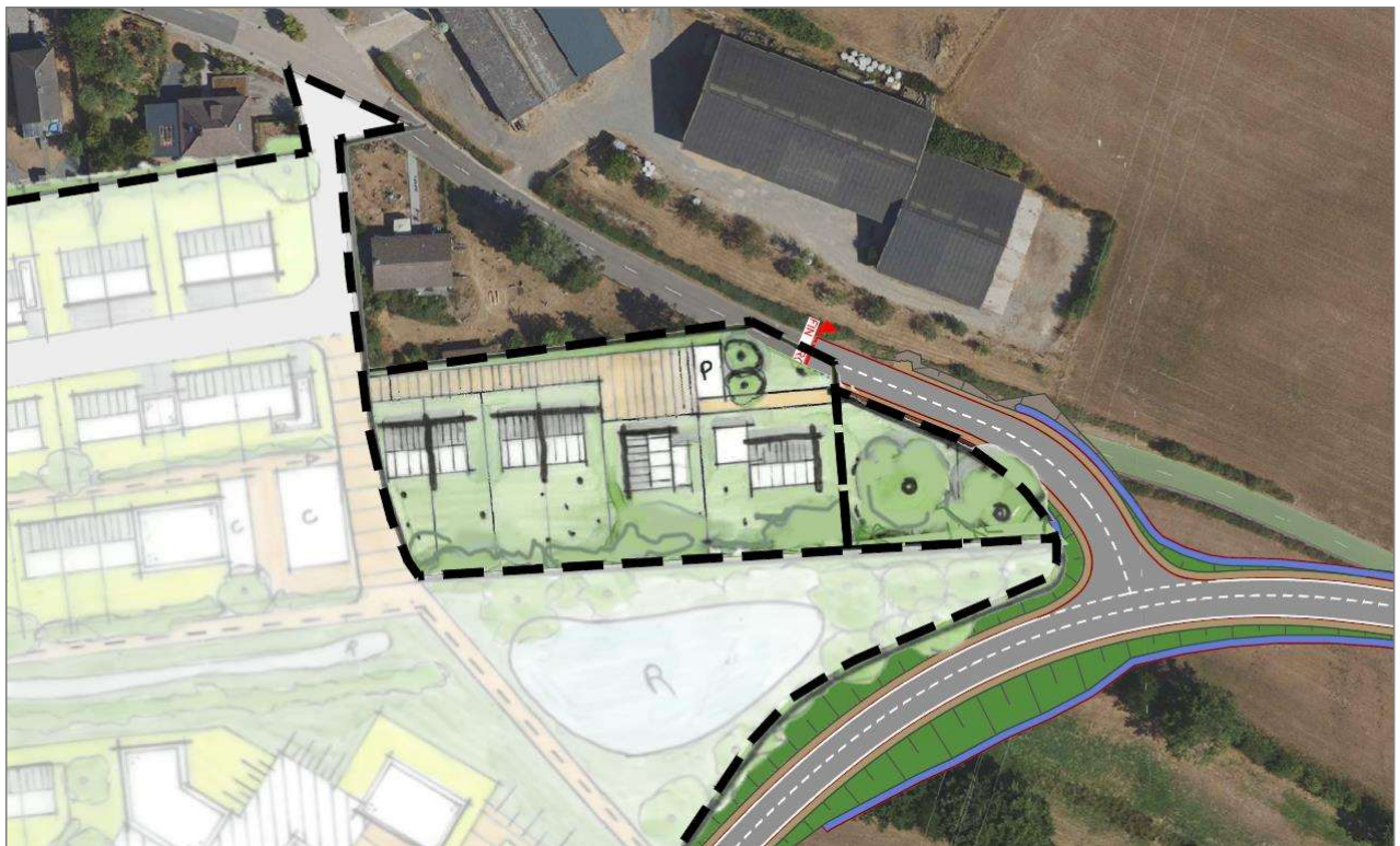
Abbildung 20: Städtebauliches Konzept der SD-Fläche NQ22.

Die von Westen nach Osten im zentralen Plangebietsbereich verlaufende Grünachse, welche durch den geplanten Erhalt der bestehenden Feldhecke (Leitstruktur Fledermäuse) eine ökologische Funktion übernimmt, ist als Begegnungs- und Erholungsraum von Bedeutung. Die öffentliche Grünfläche kann zum einen zur Ausbildung naturnaher Retentionsflächen, zum anderen auch als Aufenthaltsraum und Spielfläche genutzt werden, insofern deren ökologische Funktion nicht eingeschränkt wird.