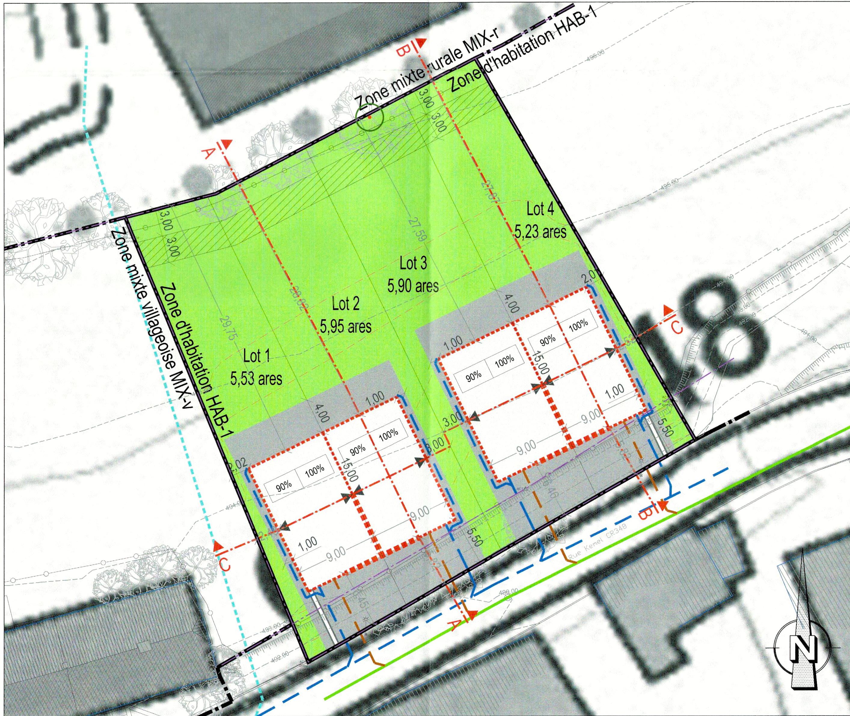
Projet d'Aménagement Particulier 1/250