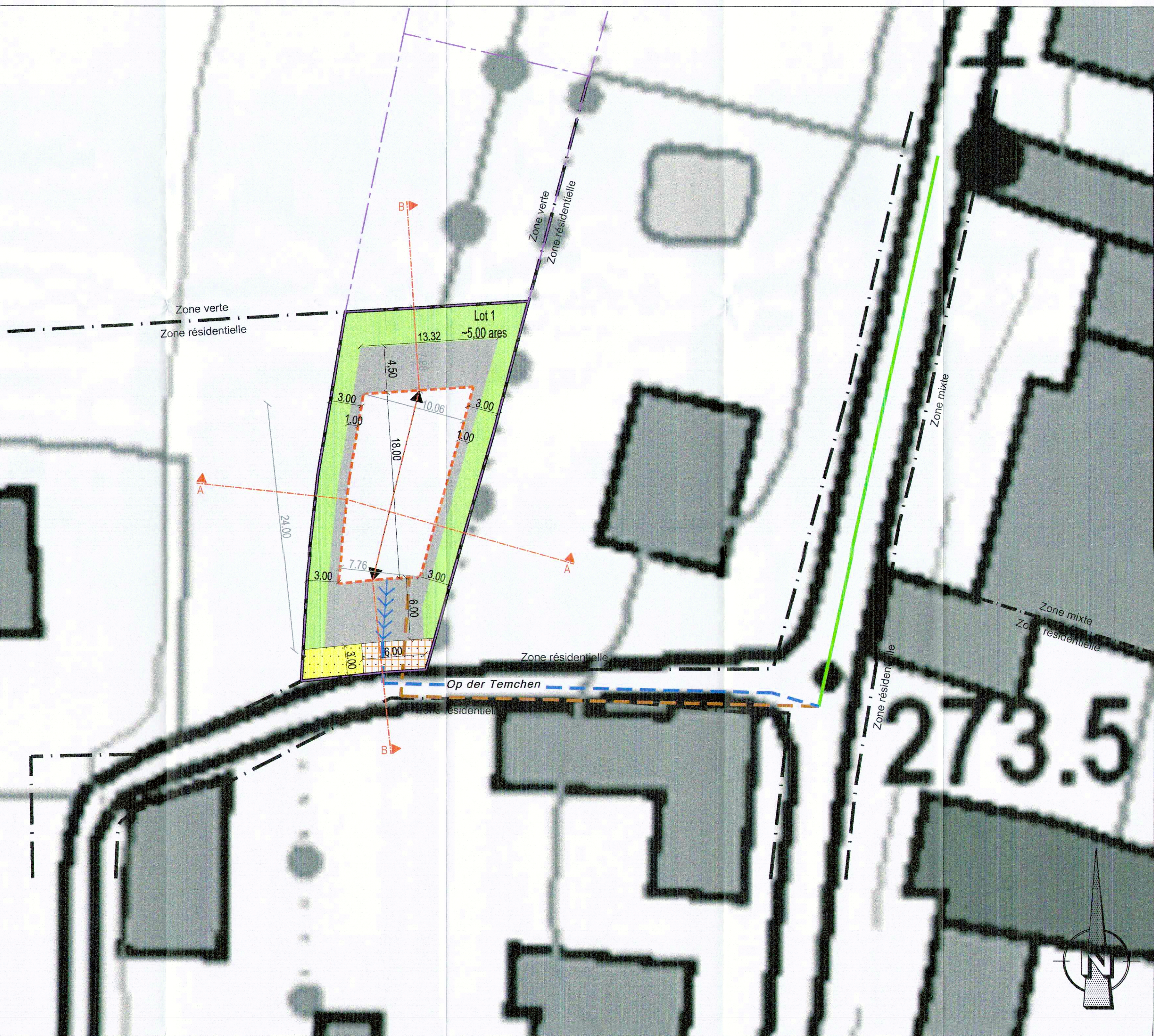
Projet d'Aménagement Particulier 1/250