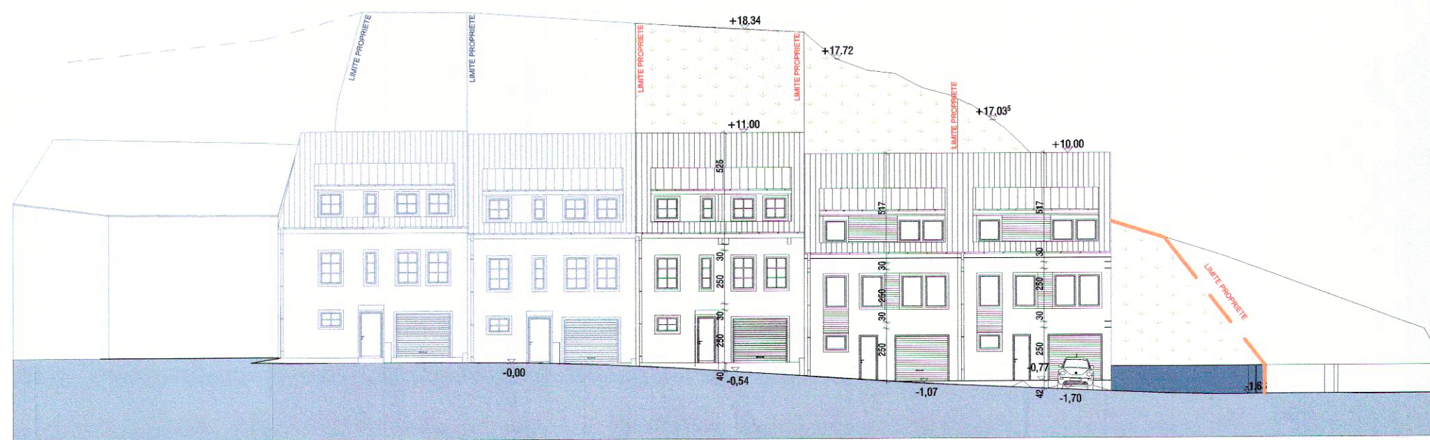
COUPE B-B 1/250