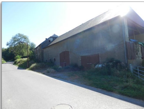
Abb. 5: Gebäude an der „Rue de Schwiedelbrouch“