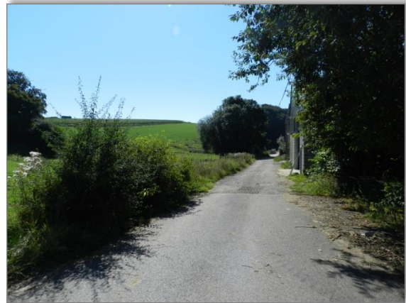
Abb. 2: Blick entlang der westlichen Plangeietsgrenze von der „Rue de Schwiedelbrouch“ Richtung Südwesten