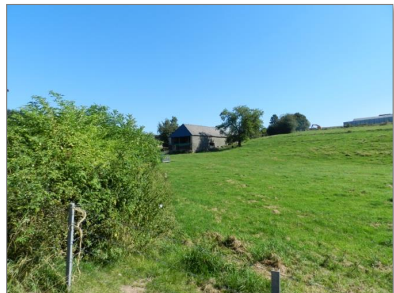
Abb. 6: Blick entlang der „Rue de Schwiedelbrouch“ Richtung Nordosten