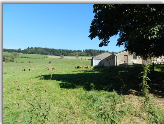
Abb. 7: Blick von der „Rue de Schwiedelbrouch“ entlang der östlichen Plangeietsgrenze nach Norden