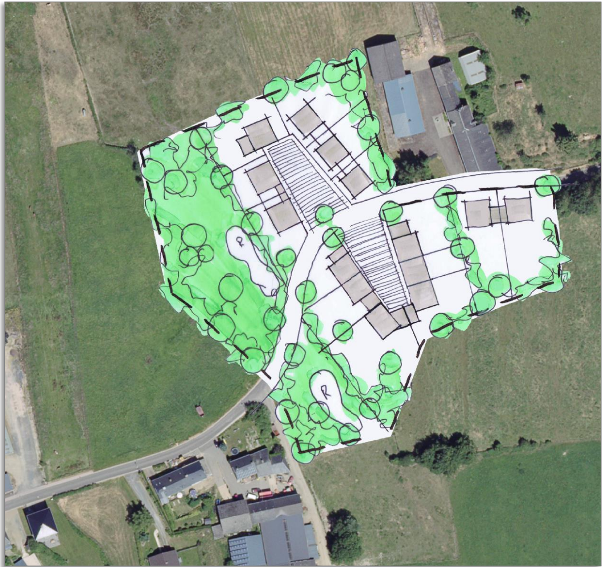
Abb. 12: Gestaltungsbeispiel Schéma Directeur Ra 5 – „Rue de Schwiedelbrouch“.