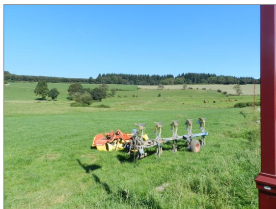
Abb. 10: Blick entlang der westlichen Plangeietsgrenze von der „Rue de Schwiedelbrouch“ Richtung Norden