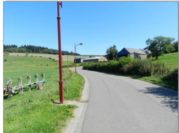
Abb. 4: Blick entlang der „Rue de Schwiedelbrouch“ Richtung Nordosten