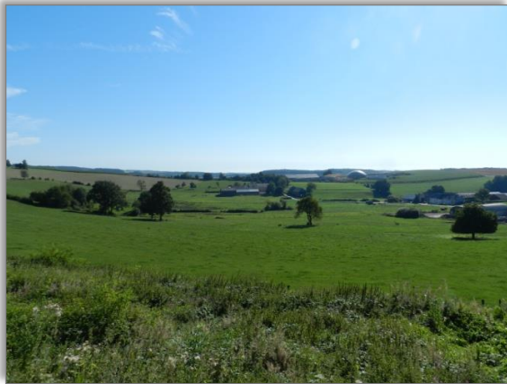
Abb. 1: Blick von der „Rue de Grevels“ auf das Plangebiet (Fernsicht)