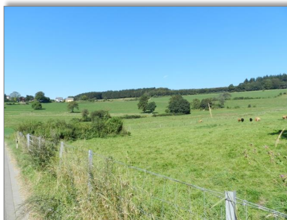
Abb. 8: Blick von der „Rue de Schwiedelbrouch“ an der östlichen Plangeietsgrenze nach Westen