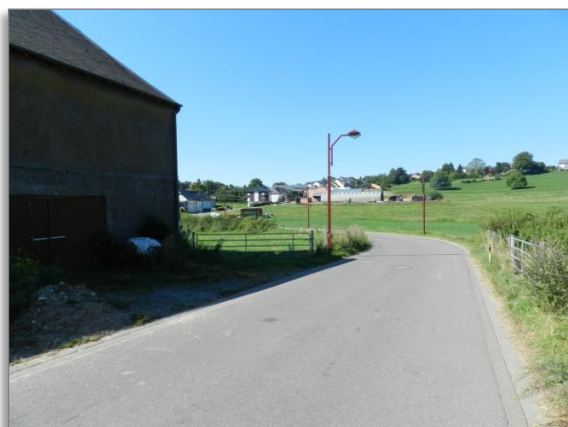
Abb. 9: Blick von der „Rue de Schwiedelbrouch“ an der östlichen Plangeietsgrenze nach Südwesten