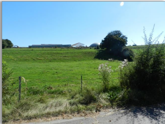
Abb. 3: Blick von der westlichen Plangeietsgrenze auf das Plangebiet