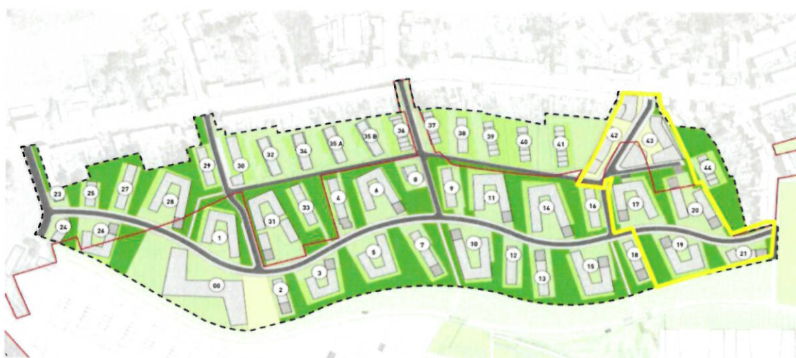
Projet directeur Belval-Nord (Elyps-Mars Group – du 25/05/2009 et modifié par Agora le 21/06/2016)