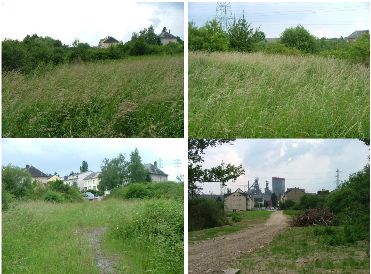
Vues sur le site