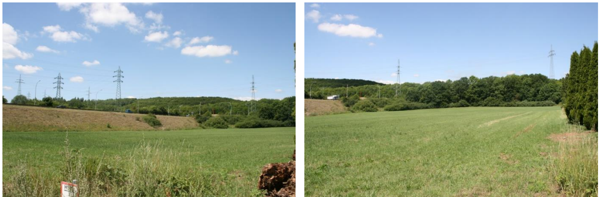
Vue sur le site depuis la rue de Differdange