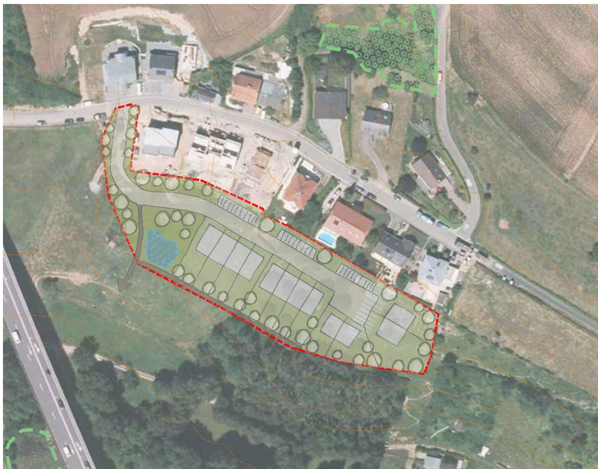
Principe d'aménagement souhaité