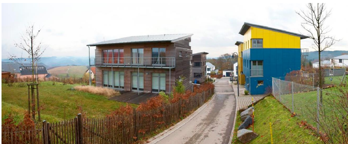
Exemple d'intégration paysagère souhaitée - Quartier Neit Wunnen à Putscheid