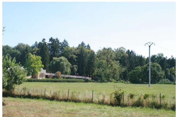
Vues sur le site depuis le site Maredoc