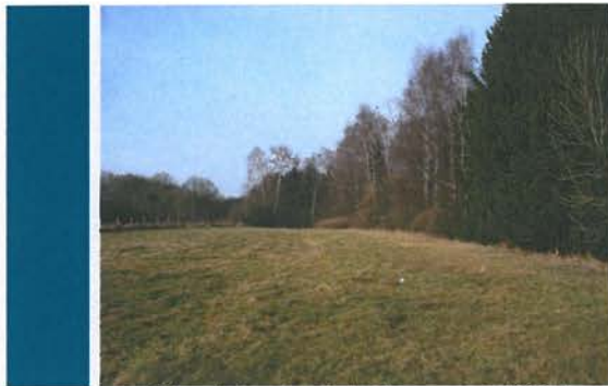
Vue du terrain et alentours avant défrichage