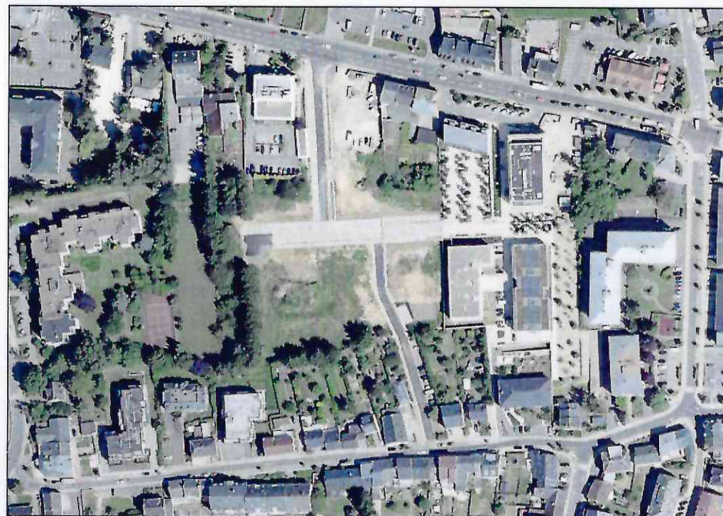
Administration Communale de Strassen

modifié selon avis de la Cellule d'Evaluation n°17674/6C