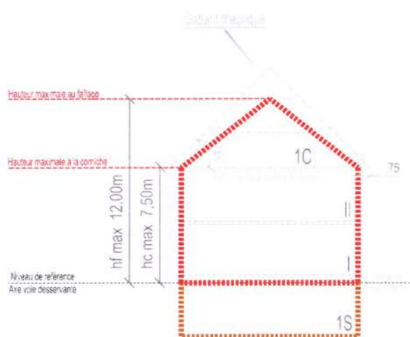
Figure 1 - Coupe-type t2 / gabarit théorique