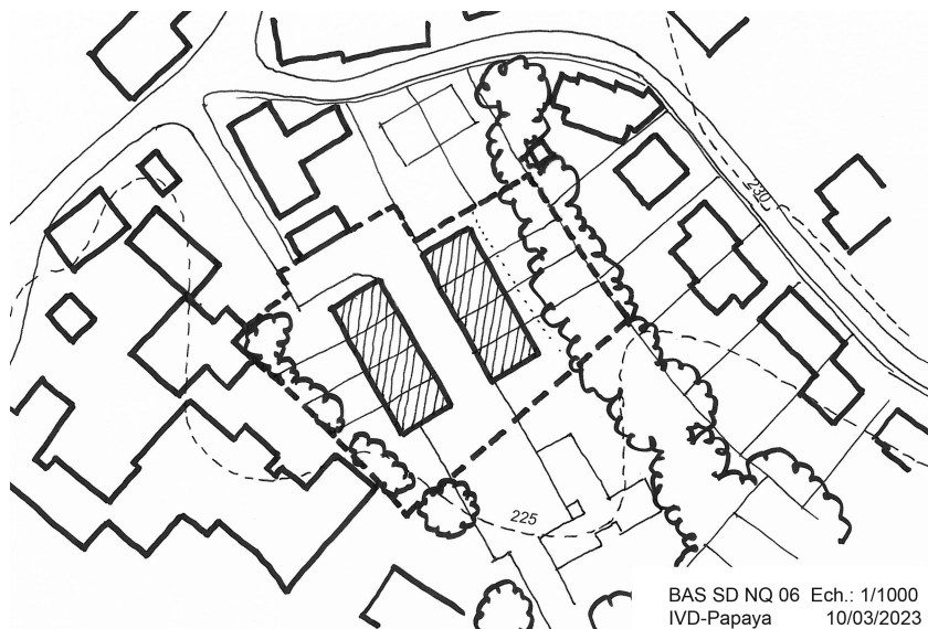
Illustration 4 : Esquisse d'aménagement possible

L'esquisse constitue un exemple et est réalisée uniquement à titre indicatif.