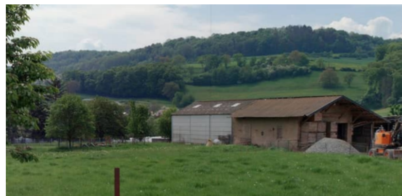
Illustrations 5: Photos du site