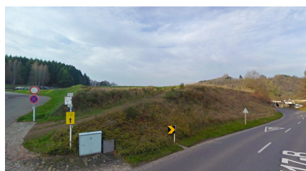
Vue vers le site depuis la pointe sud