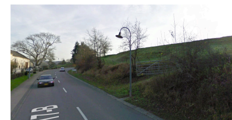
Vue vers le sud depuis la N10 et Vianden