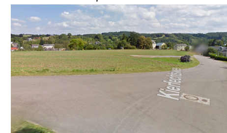
Vue vers le sud depuis le Kierfechtswee

Illustrations 3 : photos du site