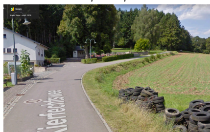
Vue vers le nord depuis le Kierfechtswee