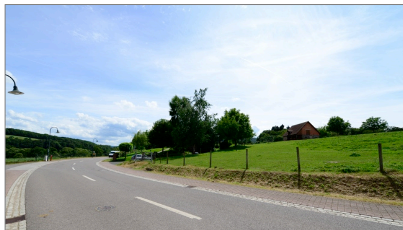
Illustrations 3 : photos du site