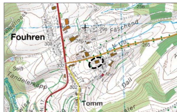
Illustration 1 : plan de situation (base : carte topographique ACT)