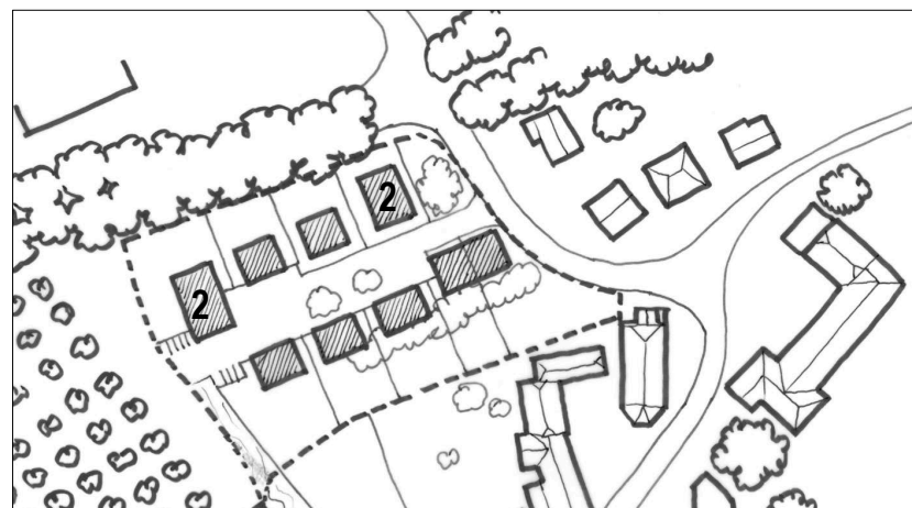
Illustration 4 : Esquisse d'aménagement possible

L'esquisse constitue un exemple et est renseignée uniquement à titre indicatif.