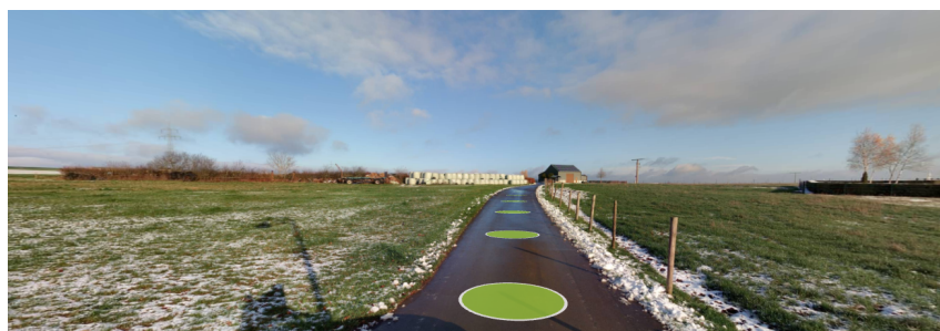
Vue depuis la rue « Am Klousterfeld » vers le nord