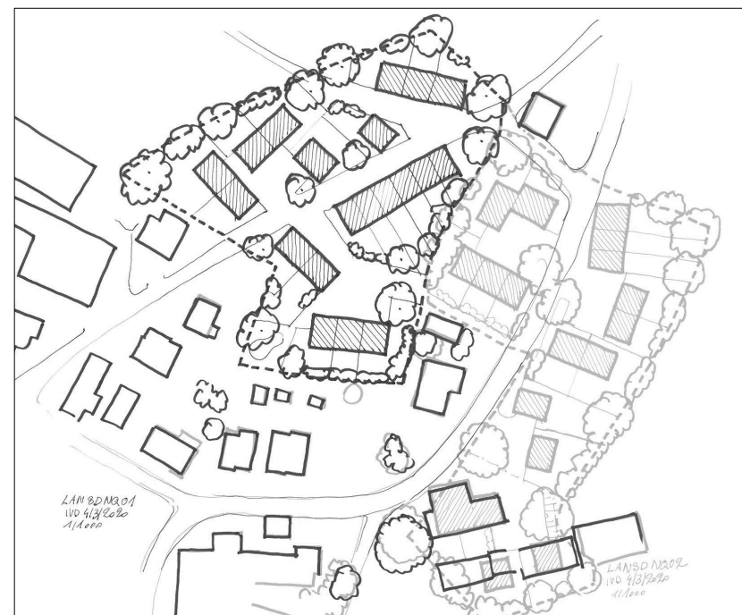
Illustration 5 : Esquisse d'aménagement possible

L'esquisse constitue un exemple et est renseignée uniquement à titre indicatif.