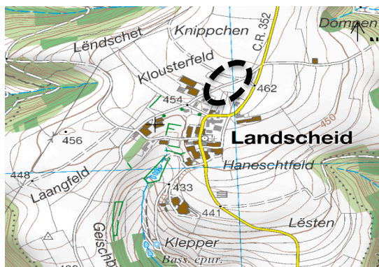
Illustration 1 : plan de situation (base : carte topographique ACT)