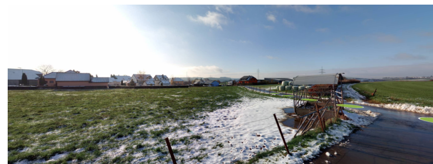
Vue depuis la rue « Am Klousterfeld » vers le sud

Illustrations 4 : photos du site