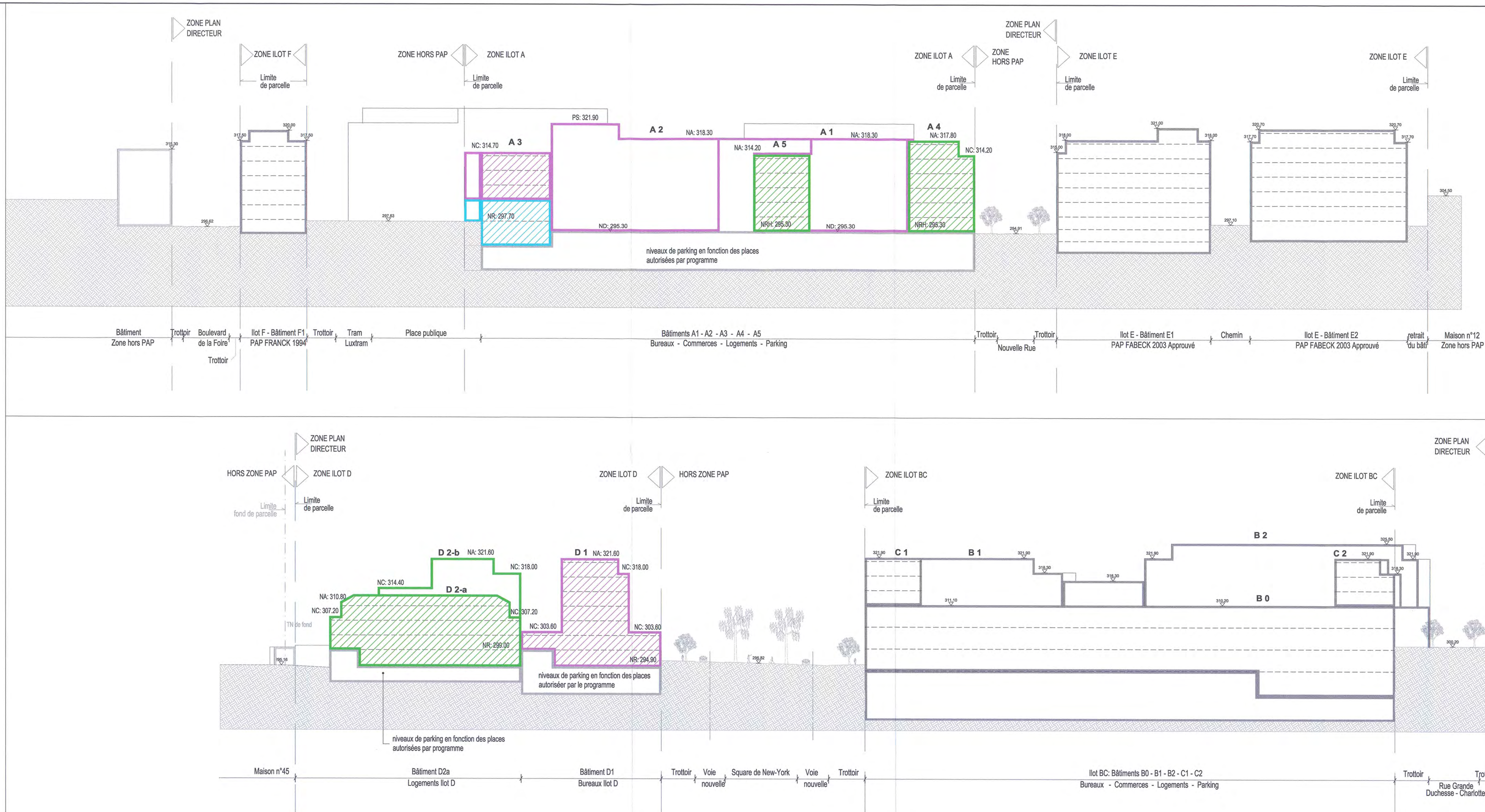
COUPE D - D'