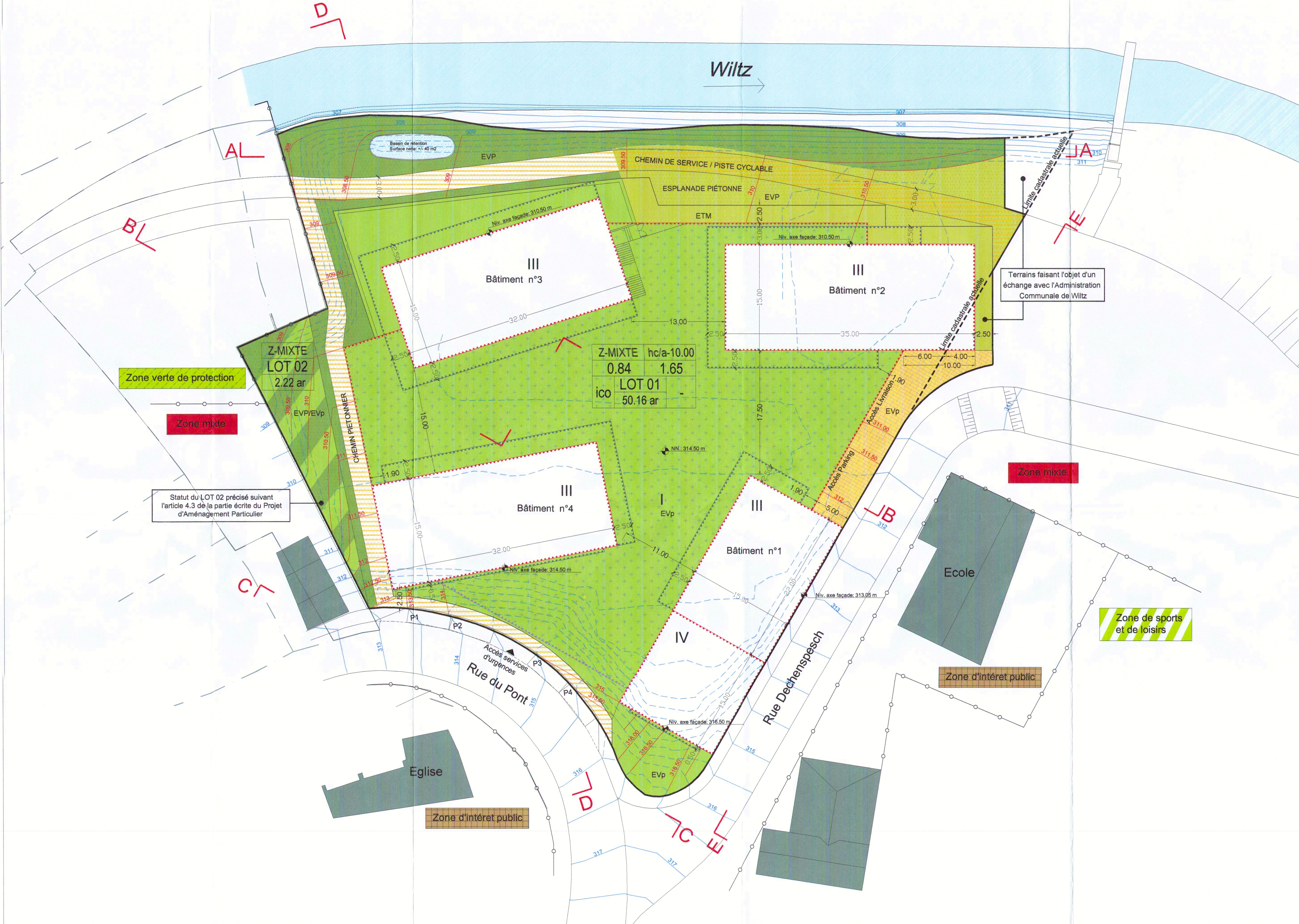
PROJET D'AMENAGEMENT PARTICULIER Ech 1: 250