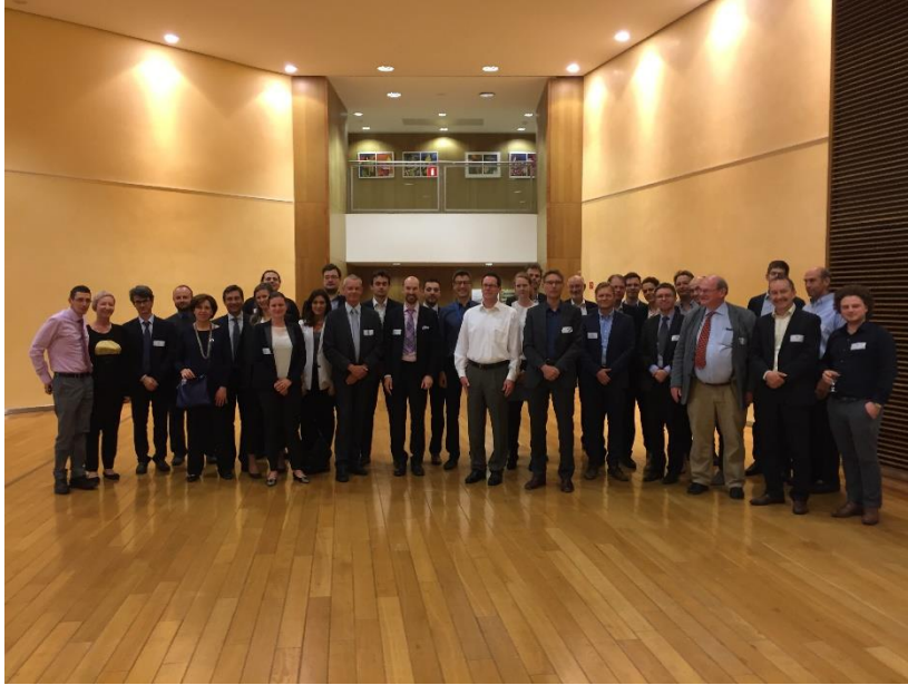
La réunion des économistes des ANC le 1 er juin 2017 à Bruxelles.

La deuxième réunion portait sur les biais comportementaux des consommateurs et leurs conséquences en termes de mesures à prendre par les ANC, sur l'affaire Google au terme de laquelle la Commission a imposé une amende de 2.42 milliards d'euros, sur le droit d'accès aux calculs économétriques entrepris par les ANC ainsi que sur la reprise de Delhaize Belgique par la multinationale néerlandaise Ahold dans le secteur de la distribution à prédominance alimentaire.